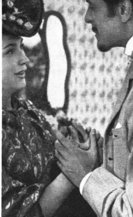
Still/scene fra Abraham Rooms »Forsinkede blomster«.

Ville han, der engang var blandt den sovjetiske stumfilms kendte instruktører, og som i 1927 rystede verden – eller i alt fald Europa – med filmen »Seng og Sofa« (originaltitel »Tretja Meschanskaja« eller »Ljubov vtrojem« – Mesjanskij-gaden nr. 3 eller Kærlighedstrekan-