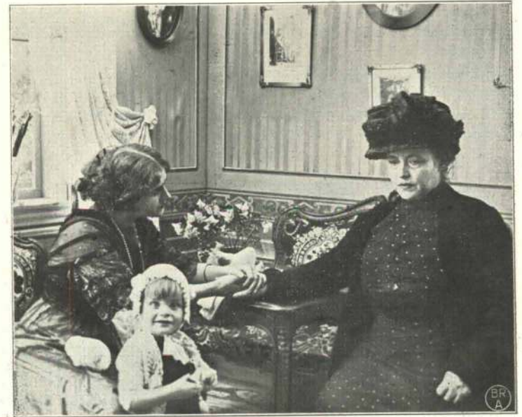
En tung Beslutning.

glimrende Fremtid, der venter hende som Adoptivdatter i det rige Bangske Hus.