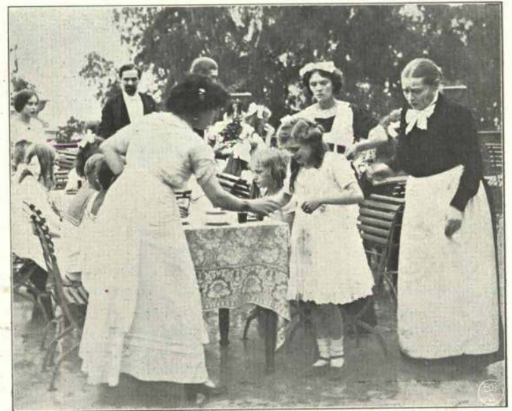
Den ødelagte Kjole.