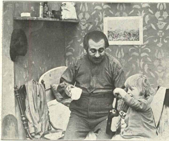
Naar Kaffen er for nøgtern.