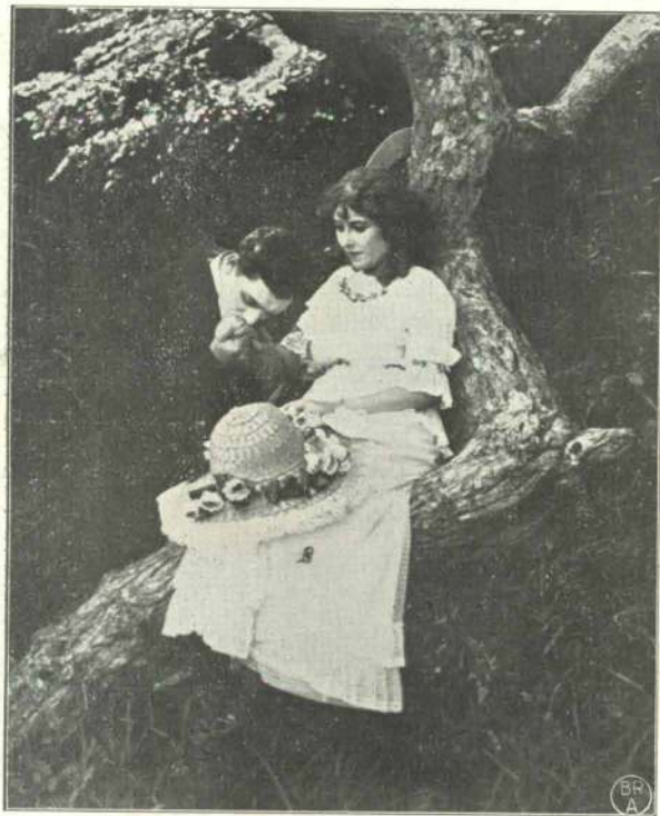
Ungdom og Sommer.

Bal-Aftenen oprinder. Den lille Anna svinger sig i Dansen til