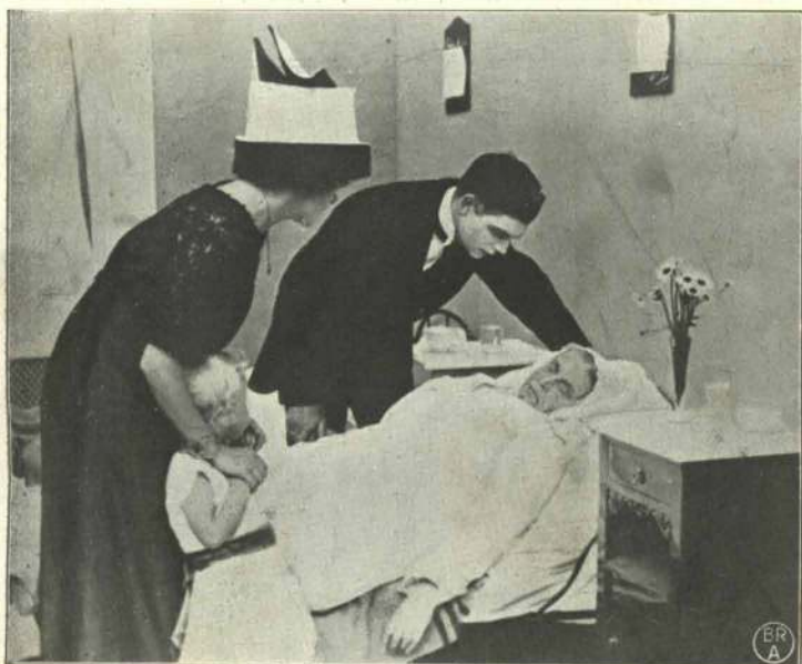
I Dødens Fred.

Jo — da den gamle Kone staar paa Dødens Tærskel, finder hun og hendes lille Anna hinanden.