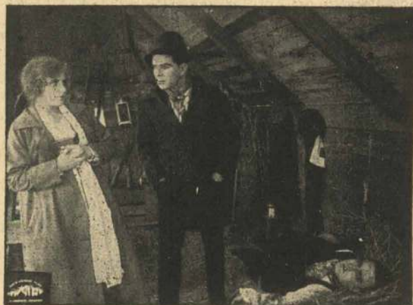
... og han blev dømt for Deres Faders Forbrydelse.

„De kan træffe mig i „Rotten“,“ raaber han. Bankdirektør Abrahams og hans Datter har været ude paa en Automobiltur, da han stiger ud ved Banken. Næppe har han imidlertid forladt Vognen, før Banditterne fra „Rotten“ kommer til Syne, springer op i Automobilten og kører bort