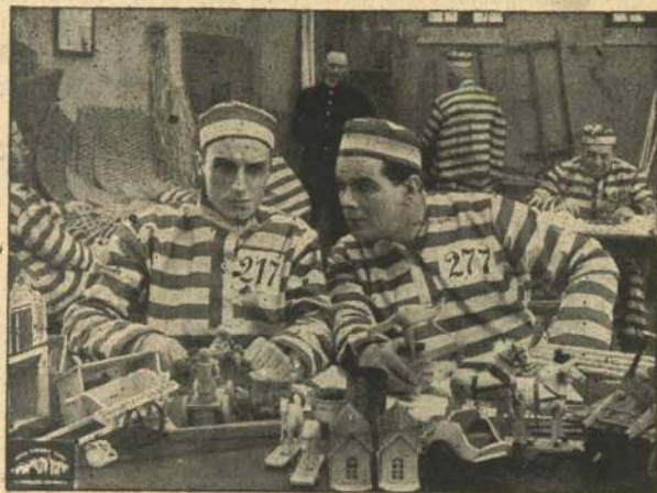
De to Venner.

Mellem Dicks gamle Kammerater bliver der