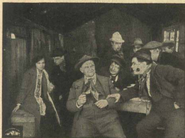
Løsesummens Størrelse drøftes.