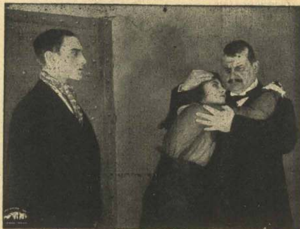
Pint af Samvittigheden.

Bankdirektør Abrahams henvender sig øjeblikkelig til Politiet, hvem han meddeler, at de sikkert kan finde Forbryterne i Beværtningen „Rotten“, og her arresterer de et Øjeblik efter Blankfort, medens Forbryderbanden allerede er flygtet med deres Bytte.