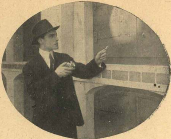
I Bankboxen ved Nattetid.