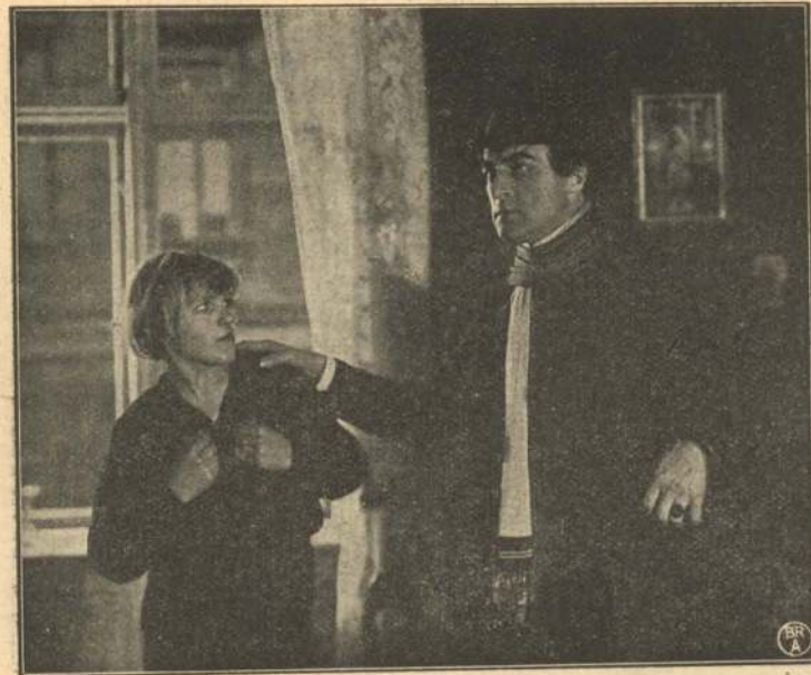
De to Brødre.

sig, men uden at han mærker det, smækker den tunge Jern- dør i bag ham og allarmerer samtidig Professoren om, at Uvedkommende har trængt sig ind i hans Allerhelligste.