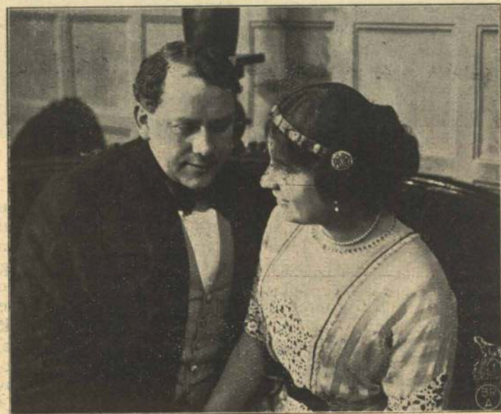
Svært fine Venner.

sit Arbejde, da nogle drillesyge Reklamebærere spankulerer lukt ind i hans Perspektiv. Han beder dem flytte