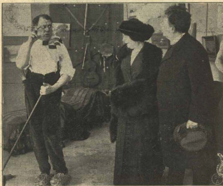
Den Døvtumme ved Husgærningsarbejdet.

En Dag har han stillet sit Staffeli op i et offentligt Anlæg, tæt ved en Hovedallé. Han er godt i Gang med