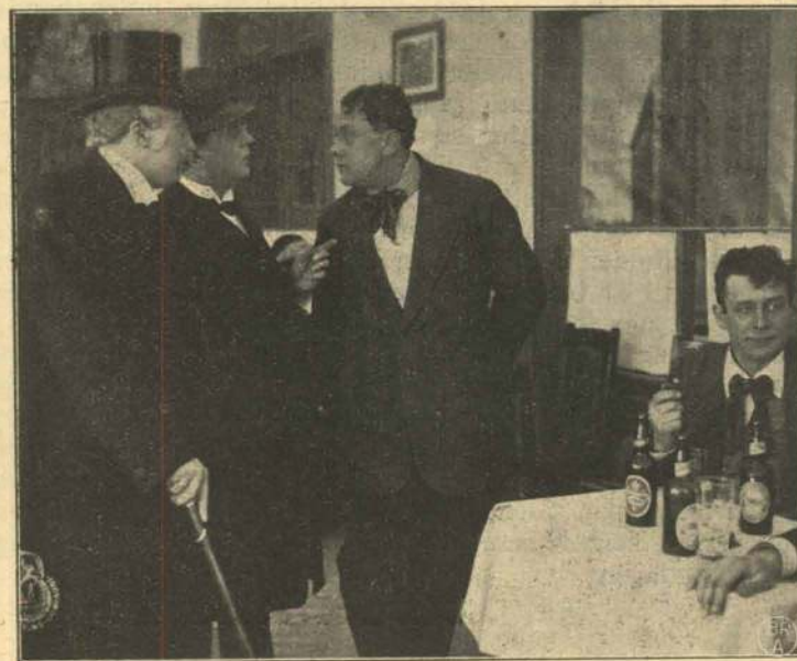
„Men, hvad i Alverden —! De er jo ikke døvstum!”

Næste Dag aflægger Direktøren for Døvstummeinstituttet sammen med Broderdatteren et Besøg hos den stak-