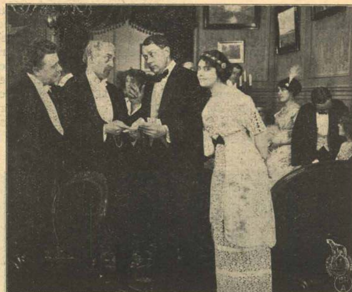
En feteret Gæst.

sit Arbejde, da nogle drillesyge Reklamebærere spankulerer lukt ind i hans Perspektiv. Han beder dem flytte