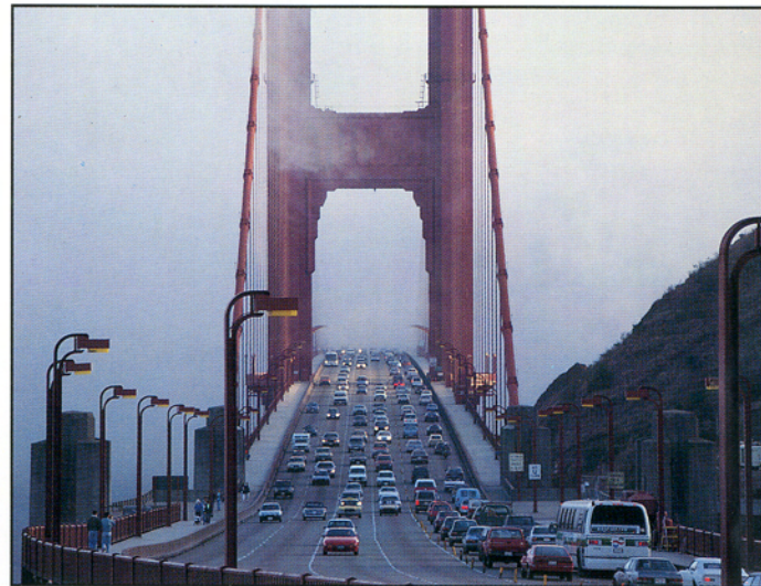
Golden Gate Bridge, San Fransisco, USA