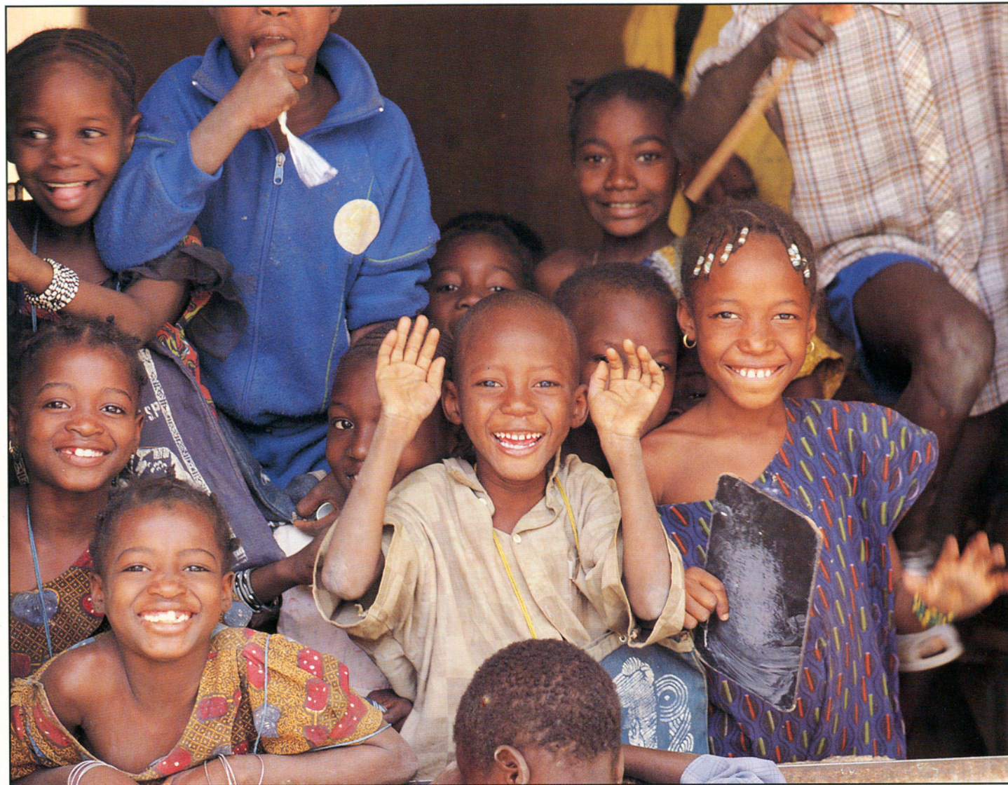
Skoleklasse i Mali, Vestafrika