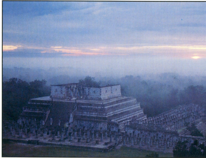
Chichen Itza, Yucatan, Mexico