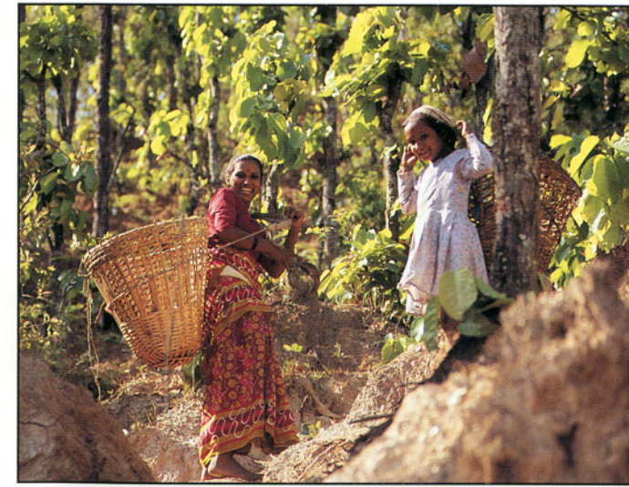
Mor og barn, Nepal