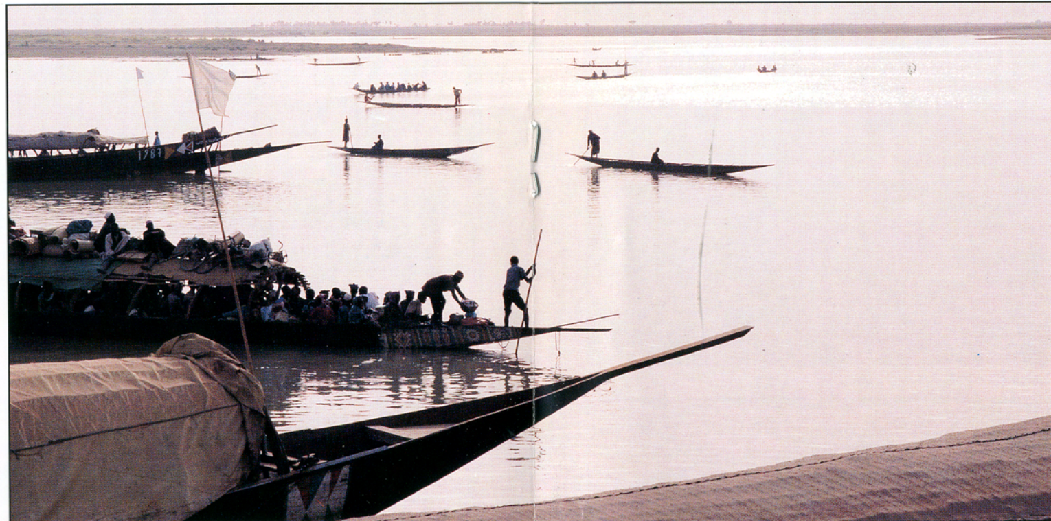
Både på Nigerfloden, Mali

Ikke alt, som forandrer omgivelserne og os selv er fremskridt. I må forsøge at finde ud af, hvad er det bedste i civilisationen, som vi må beholde. For vi kan ikke gå helt tilbage til naturen, det er umuligt.