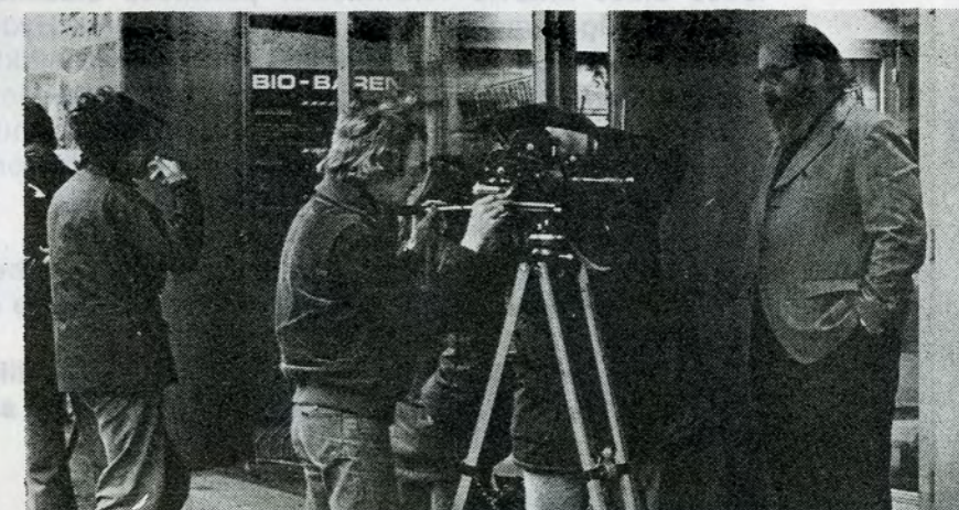
Teknisk travlhed før filmoptagelse. Onde tunger siger, at personen til højre var glatbarberet, før optagelserne begyndte.

Fordi BT-Klubben lige fra begyndelsen fik rodet sig så grundigt ind i hele arbejdet med filmen — med typografer i selve filmgruppen, med styrelsesmedlemmer i en redaktionskomité der mindst én gang om ugen blev nødt til at tage stilling til, hvad der foregik i klippebordet, osv. — og fordi de professionelle filmfolk ikke var købt til at gøre arbejdet, men havde stillet sig gratis til rådighed, kunne der opstå et gensidigt tillidsforhold, der gjorde det muligt for BT-Klubben at optræde med