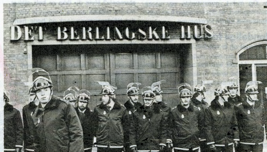
Med ryggen mod Berlingske Tidendes mur. Og front mod B.T.-Klubbens grafiske arbejdere.

Resultatet blev et kompromis med de reaktionære kræfter i Folketinget. Som