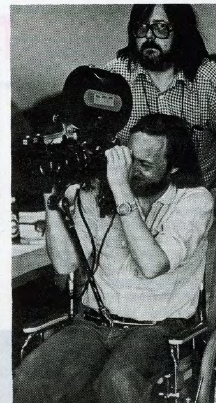
En rullestol — organiseret fra typografernes plejehjem — viste sig uforlignelig til de »glidende« optagelser.

Det fungerede, og samarbejdet til fotograferne var formidabelt. Selvfølgelig kunne vi »råve« efter hinanden, men det lykkedes aldrig at blive rigtig uvenner. Fra starten havde typograferne sagt, at de ville respektere »profferne« fra filmbranchen, og vi holdt mange møder med efterkritik. Hele filmen blev til med kun ét tilfælde, hvor vi var uenige i gruppen om nogle optagelser. En var imod en rejse til Ålborg, som han mente var unødvendig, og i det ene tilfælde gennemførte grup-