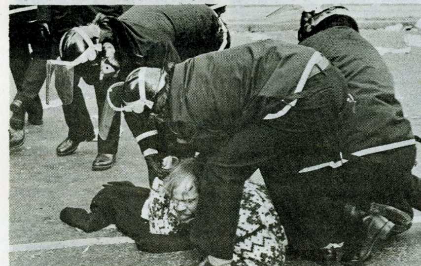
Efter justitsministeriel målestok går der tre politibetjente på én grafisk arbejder.

21. juni kom — med nogen forsinkelse, det første eksemplar af Berlingske Tidende siden 30. januar 1977 atter på gaden, bortset fra de skruebrækkerudgaver den 25., 26., 27. og 28. april 1977.