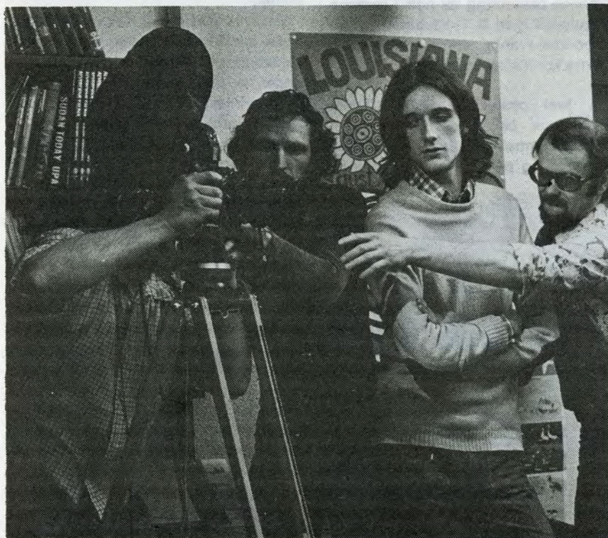
Et grotesk studie i kameraindstilling, hvor fotografen synes helt at have mistet hovedet.

Jeg fik travlt den aften. Først skulle jeg skaffe apparatur af et omfang, der ville koste en plovmand at leje pr. dag . . . gratis. Selv om vi kun regnede med en optagelsestid på tre uger, og selv om det var ved vintertide, kunne dette ikke altid være lige let . . . og ville de kammerater jeg skulle henvende mig til, gå ind for de upopulære typografer. På det tidspunkt var konflikten allerede i store dele af den borgerlige presse blevet skreget ud som en kommunistisk dirigeret manøvre, der blev styret direkte fra Dronningens Tværgade, og ingen af dem jeg ville have med, kunne kaldes ekstremt venstreorienterede. Jeg kommer vist ingen for nær, når jeg endda røber, at der er et par godt borgerlige iblandt . . . Men jeg mente, at det var vigtigt, at professionelle filmfolk, fagligt anerkendte, klarede opgaven. Både for at opnå et så kvalitativt produkt som muligt, men også for at markere at vi bør befordre ytringsfriheden så langt vi formår. Og film er et vigtigt medium. Men film er dyr . . .