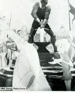
1 spaltet anmelderkliché

Jo, det er løjer. Sikken en gave til påskeferien. Store og små kan glæde sig til den.