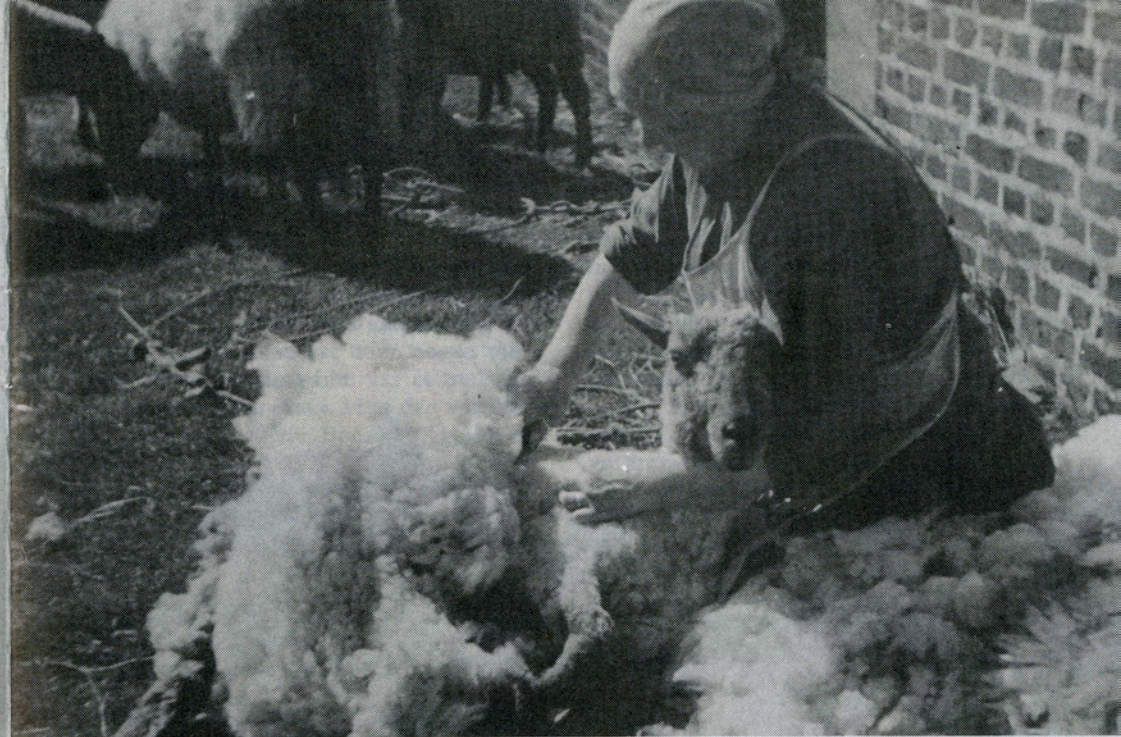
Danmark — PH 1935

under filmen.« Filmen fik endelig — stadig i den nedklippede version — offentlig Københavns-premiere i Kinografen den 16. december.