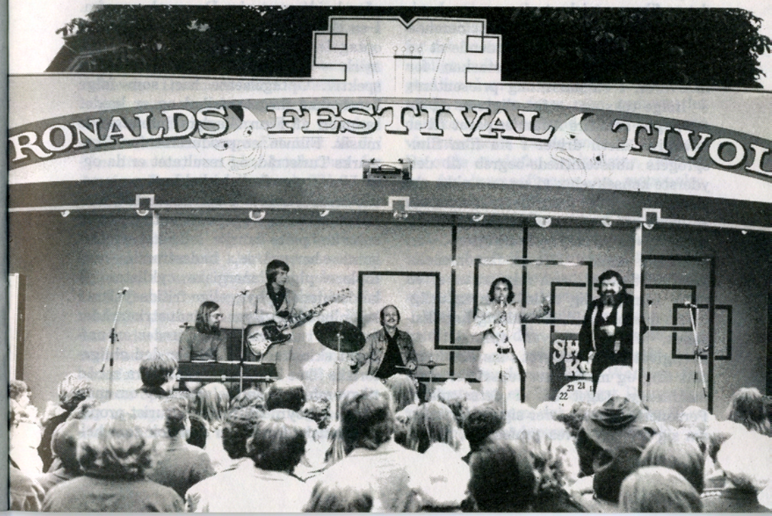
Danmark A + B

Fælles for PHs, Brydesen-Rifbjerg-Ørstedes og Refns Danmarksfilm er, at de nok er kunstnerisk ambitiøse og personlige Danmarksbilleder, men samtidig bekender sig til turistfilmens og den oplysende films traditioner. Alle tre giver et i bogstavelig forstand overfladisk billede af Danmark. Danmark er i filme-