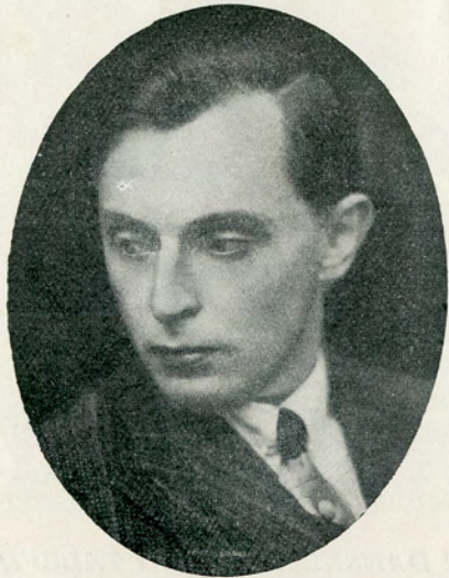
INSTRUKTØR: GEORGE SCHNÉEVOIGT