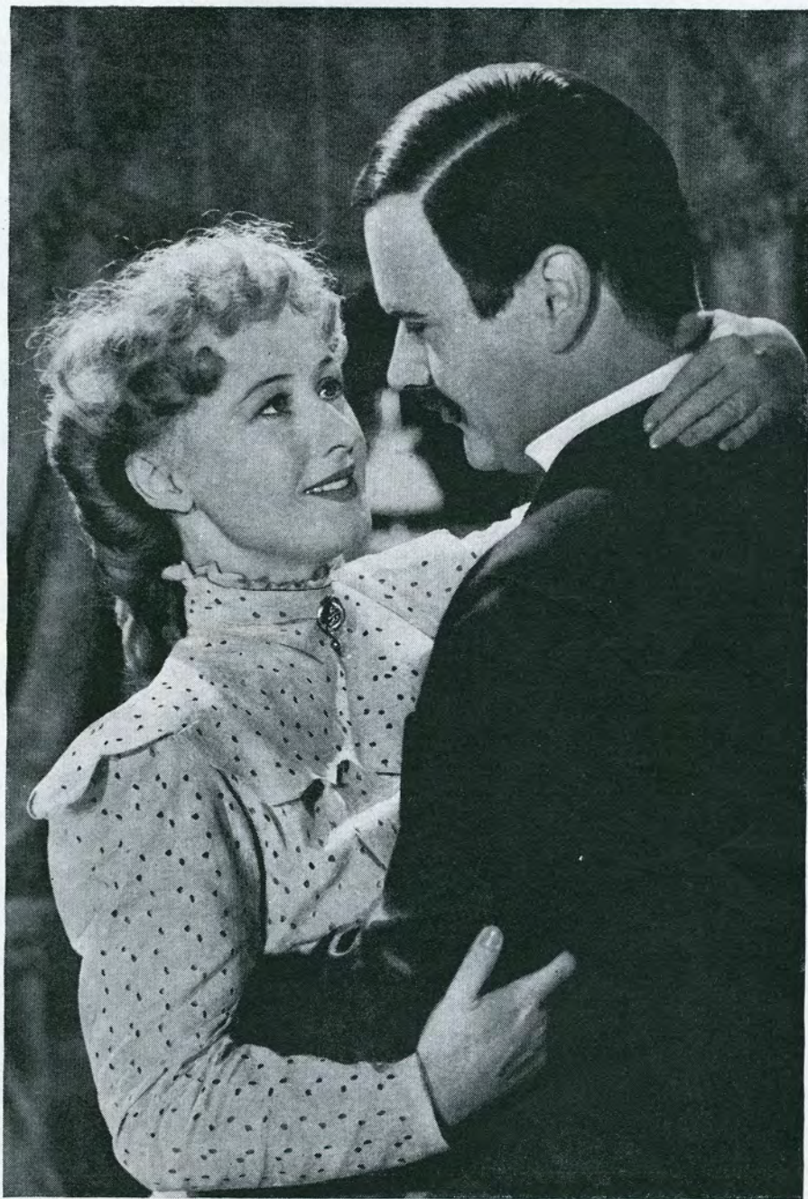
I de unge lykkelige år.