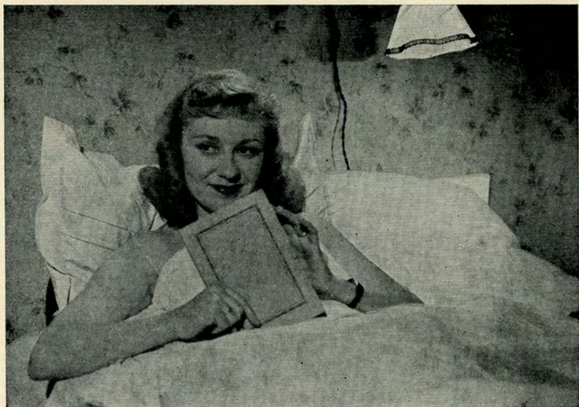
— Jeg har aldrig læst bøger, men jeg har da en bog.