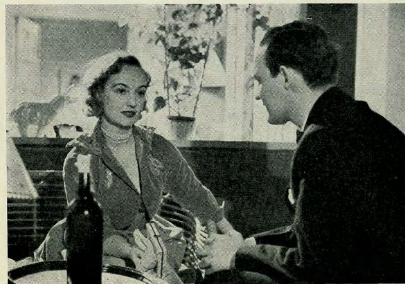
— De minder mig meget om min mand — De er vist også frygtelig karakterstærk —