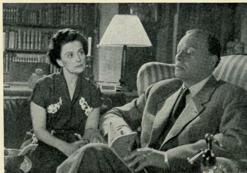
— Thomas — vi kender ikke vor egen søn!

Ingen ved, hvad den bog hedder, og hvad der egentlig står i den, men den skaber konflikter og griber ind i mange menneskers liv, så der i adskillige tilfælde kommer noget godt ud af det — den kan altså ikke være helt umoralsk, selv om den stammer fra Paris!