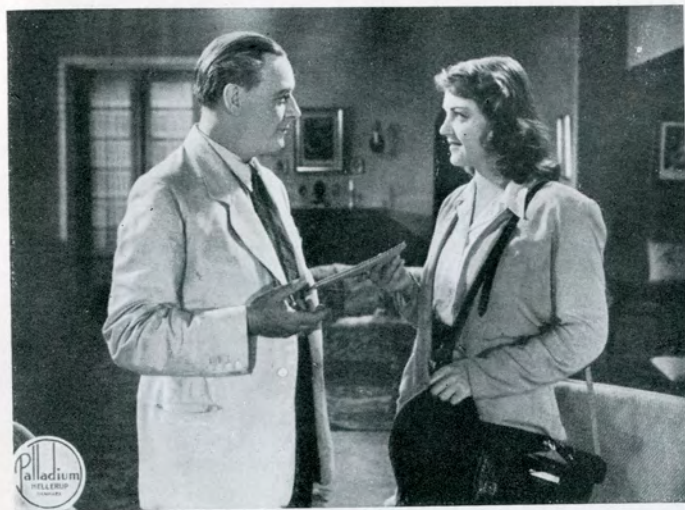
Carlo Wieth og Bodil Kjer.