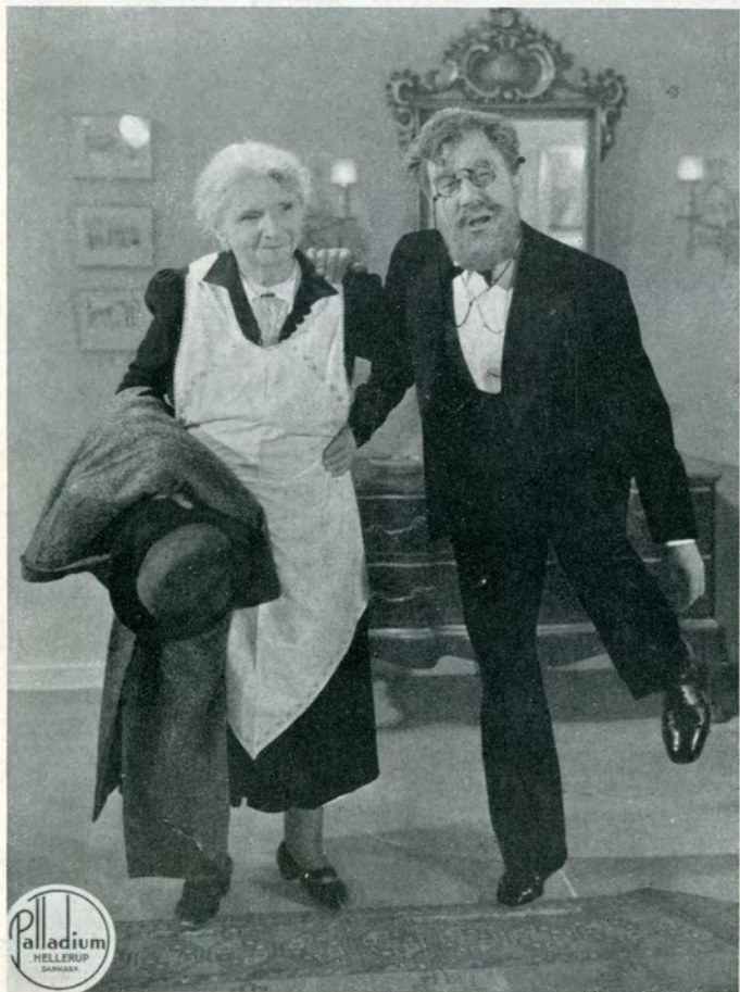
Programmet — Redigeret af Ole Palsbo A/S L. IHRICH'S BOGTR.