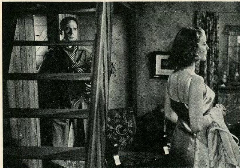
— Du opfører dig som et forkælet barn, Sonja!

Netop denne morgen kommer politiet og fortæller ham, at hans søn er fundet druknet i fiskerbyen, hvor han boede, og Christiansen bliver en anden, forvandler sig, han er ikke længere en fredelig, lille borger, han er pludselig faderen , hvis eneste barn er blevet borte, og han vender sig mod den hylde, hvor alle sønnens sølvpræmier fra de unge år står,