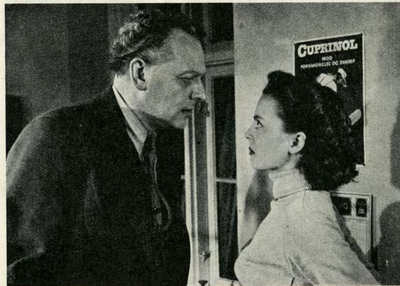
— Holder I stævnemøder, når jeg ikke er her?