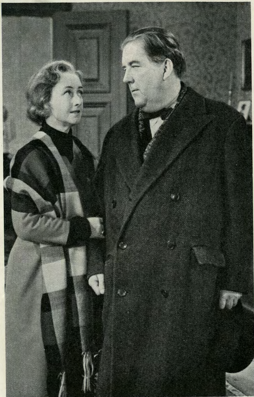
— En frygtelig ulykke med Deres søn — jeg ved jo ingenting —