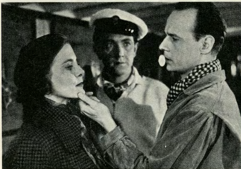
— Skal han fornøje sig med dig nogle dage — ?