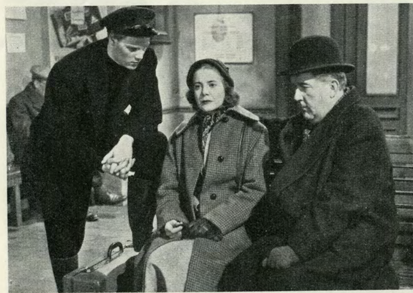
— Jeg har ikke gjort noget — det var ikke min skyld!