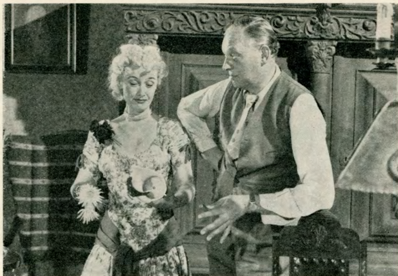
„Salgschefen“ og hans frue.