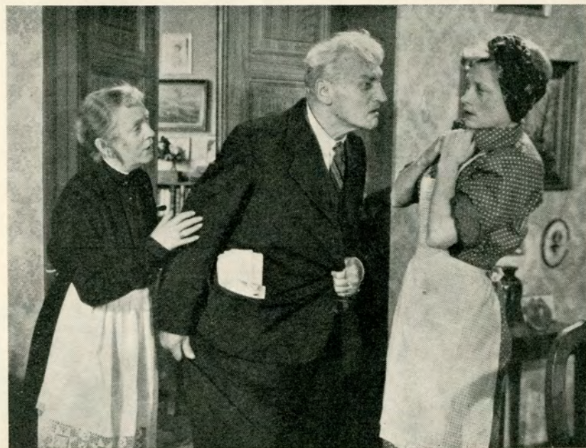
Redaktør Sort lader sin vrede gå ud over den ny husassistent.

Amor driver sit kåde spil på „Lykkesgave“. Ikke blot mellem Helga og chaufføren, men kokkepigen er lønligt forelsket i landsbyskræderen Opdal. Helga intrigerer så snedigt, at de to omsider forenes, og der bliver også et par ud af køkkenpigen Olga og gartneren Andreas. Alt er dog ikke lutter idyl. Da Jørgen og andre af Helgas tidligere omgangskreds uventet dukker op, føler Hans Frigaard sig ført bag lyset, og historien tager en dramatisk vending, indtil hun får klaret sagen. Med et nyt syn på tilværelsen kan Helga vende hjem til villaen på Strandvejen. Hun har ikke alene vundet væddemålet, men også den mand, hun elsker.