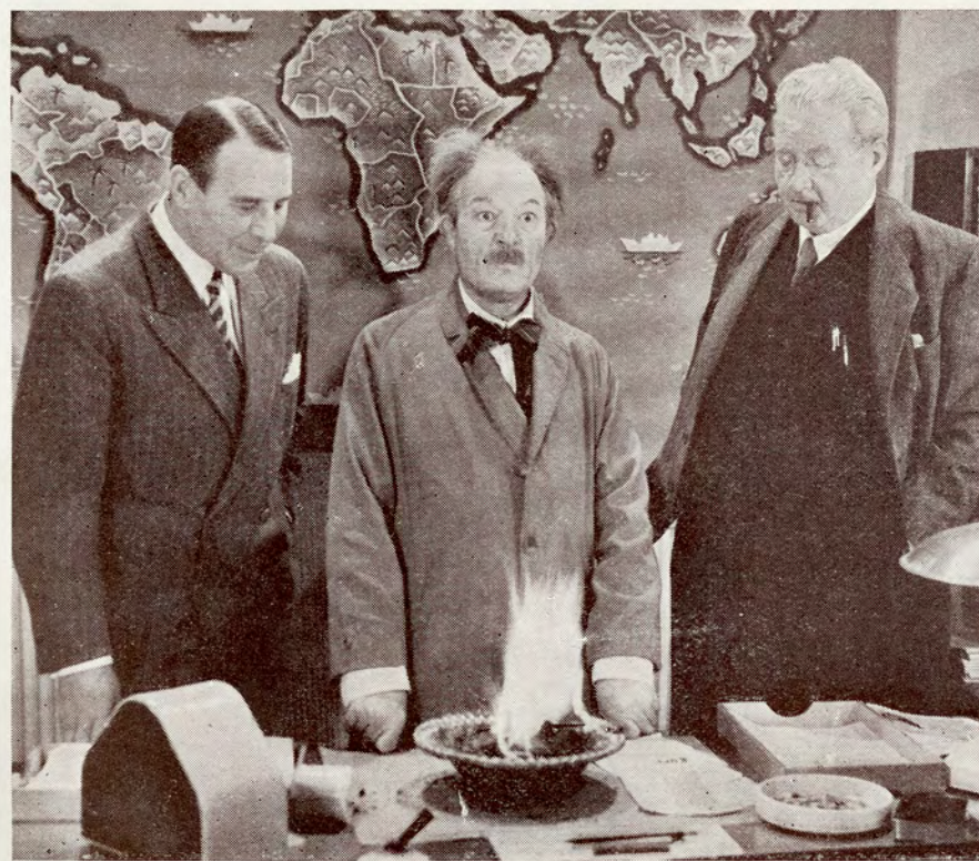
Chefredaktøren, Krone-Strøm og Administratoren bekæmper Pengerigeligheden — effektivt!

vilde bringe, er det Ulykker, der nu følger i hans Spor. Længe holder han stædigt fast ved, at han har Ret i sin Fortolkning af de økonomiske Love, men til sidst brister Troen for ham. Han ser Sagens rette Sammenhæng: Velsignelsen skabes ikke af Penge , men af Arbejde. Det er i Produktionen, Værdierne ligger. Naar Pengemængden er for stor i Forhold til Varemængden, maa den sidste bringes op og den første ned. Atter en Gang prøver han at løse Problemet paa sin egen Maade, og ogsaa det Eksperiment er ved at bringe ham selv i Fortræd paany. Men . . . ja, saa omsider finder Idealisten Vejen, ad hvilken han kan tjene Almenvellet.