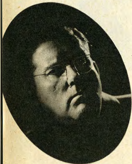
MANI - Historien om Klassens tykke Dreng

„Mani“ er Fortællingen om Klassens tykke Dreng, der ved Kammeraternes Spot forenet med en forkælet Opdragelse i et rigt Milieu paaføres en Række Mindreværdskomplekser, der gør ham til Forbryder.