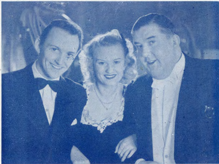
Ulrik og Gerda Neumann og Ib Schönberg.

Impressario og Teaterdirektør Ib Stockfeldt er i en forfærdelig Knibe. To af hans Hovedkræfter, Gerda og Ulrik, har forladt ham i Vrede, og hans Søndagsforestilling truer med at gaa i Vasken. Hvad skal han stille op?