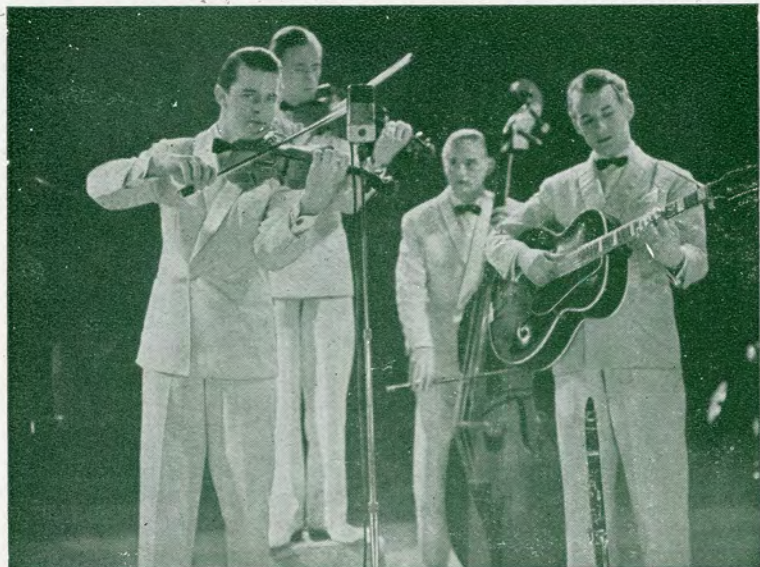
Svend Asmussens populære Kvintet spiller

man har liggende? Idéen vækker Direktørens udelte Bifald, og med Fortæppet som Lærred præsenteres Publikum nu for den elskelige Klovn August Miehes overdaadige Løjer, og Ludvig Brandstrup og Osvald Helmuth i en humørfyldt Sketch, der ender med at Helmuth synger sin Sukcesvise »Foroven og fornejen«.