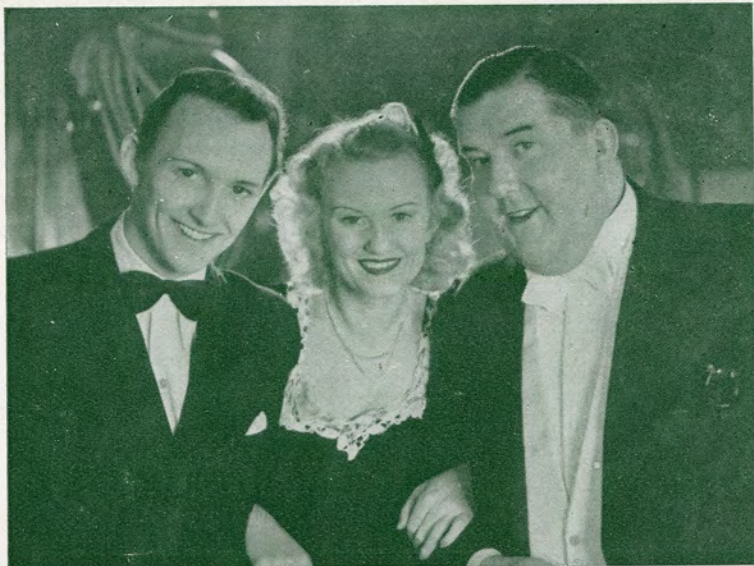
Ulrik og Gerda Neumann og Ib Schønberg

I mpressario og Teaterdirektør Ib Stockfeldt er i en forfærdelig Knibe. To af hans Hovedkræfter, Gerda og Ulrik, har forladt ham i Vrede, og hans Søndagsforestilling truer med at gaa i Vasken. Hvad skal han stille op?