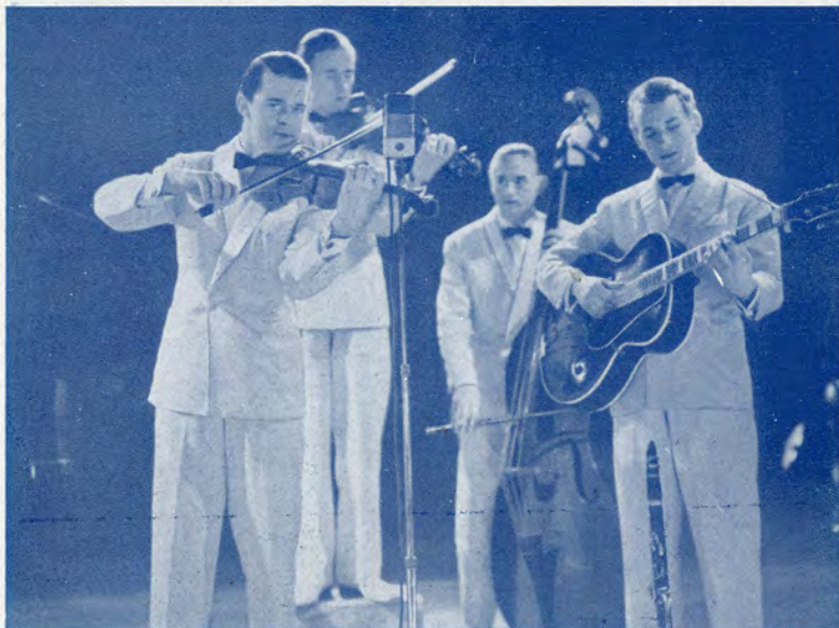
Svend Asmussens populære Kvintet spiller.