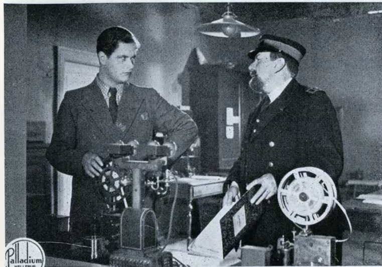
— Saa kan De jo passende underholde min Datter om det muntre Liv i Natklubberne.