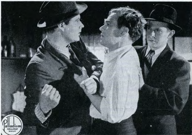
— De skal ikke faa Lov at odelægge mig!

Og saa udvikler Begivenhederne sig Slag i Slag. Med eet tager Sagen en ganske overraskende Vending, og i Løbet af kort Tid er Warholt klar over, hvem der skubbede Kragfeldt ud foran Lokomotivet. Han har fundet Morderen, og Morderen tilstaar!