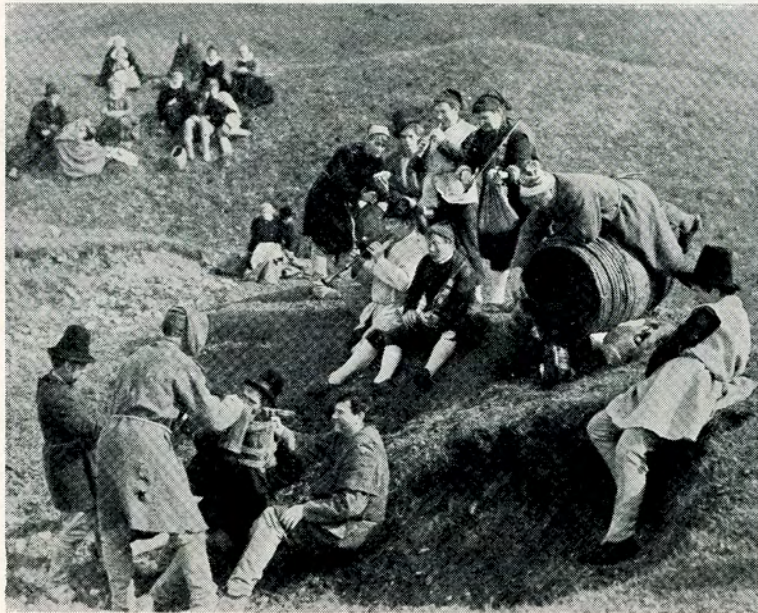
Kalkbrænderfesten i Daugbjerg

Jeppe Aakjærs Heltekvad om Jens Langkniv bliver ved sin indre Kraft noget mere end Fortællingen om en Røver i et lille Sogn i Jylland. Det rummer Problemer, som er ældre end 1600-Tallet og som er aktuelle den Dag i Dag. Jens Langknivs Skæbne, som den i Romanen og Filmen fortælles gennem en magtfuld og enkel Handling, er typisk til mange Tider.