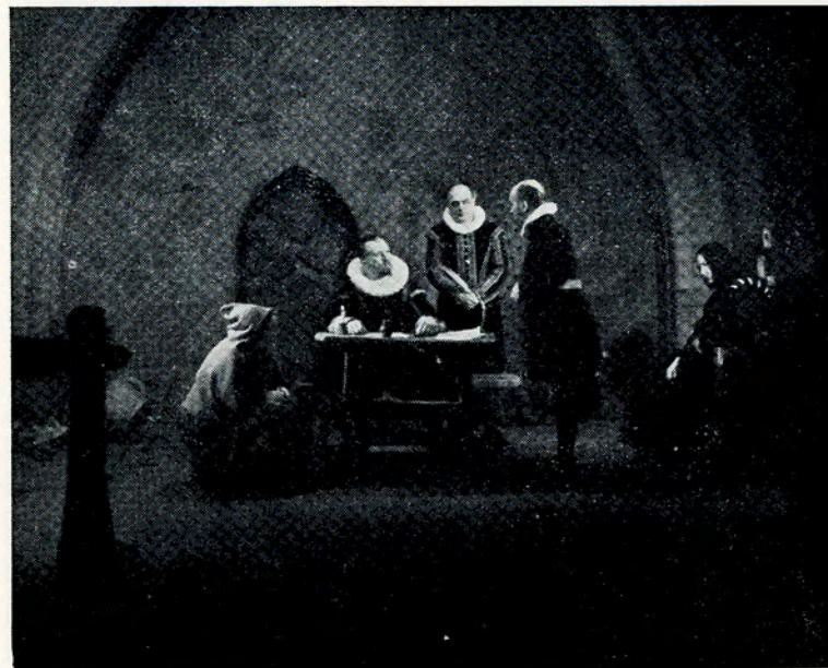
Hekseprocessen hos Lensmanden

Hertil har ogsaa Det kgl. Teater bidraget ved at stille Tidens Dragter til Raadighed for Fotorama Filmbureau. »Den gamle By« i Aarhus har elskværdigt givet Tilladelse til, at vi maatte optage nogle Scener i Borgmestergaarden. Og paa Musikhistorisk Museum har vi laant den musikalske Tidskolorit. Vi bringer de to Institutioner vor hjerteligste Tak.