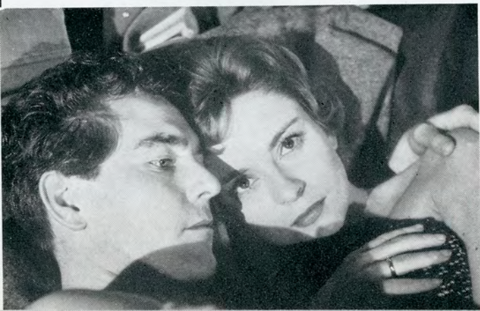
Holger Juul Hansen - Helle Virkner

I OVER ALLE GRÆNSER har Helle Virkner sin hidtil største dramatiske filmrolle efter hun har været de fleste filmgenrer igennem, og man husker især den yndige skuespillerinde fra roller i film som OTTE AKKORDER (44), HIMLEN ER BLÅ (54), KISPUS (56), TANTE TUT FRA PARIS (56), AMOR I TELEFONEN (57) og ENGLen I SORT (57).