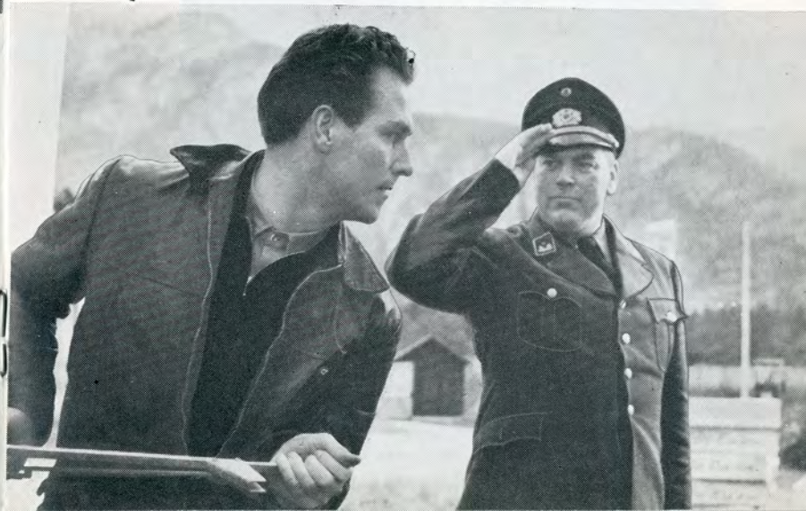
Holger Juul Hansen - Tysk grænsevagt

Mens politiet efterforsker VERA's veje, beslutter hun for sin part frivilligt at vende hjem, fordi hun føler det, og samtidig er der foregået en udvikling i ERIK, han har indset, at hans tilværelse var ved at blive vane - udvændighed og travlhed, mere end menneskelighed - kærlighed.