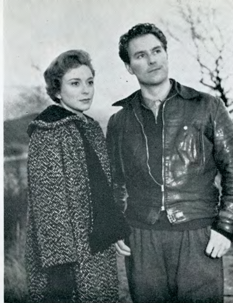
Helle Virkner - Holger Juul Hansen