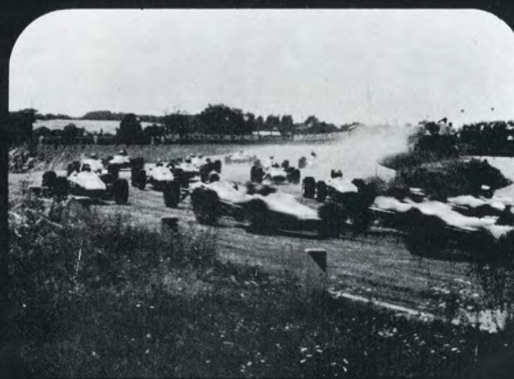
...nervøpirrende spænding under løbet på racerbanen