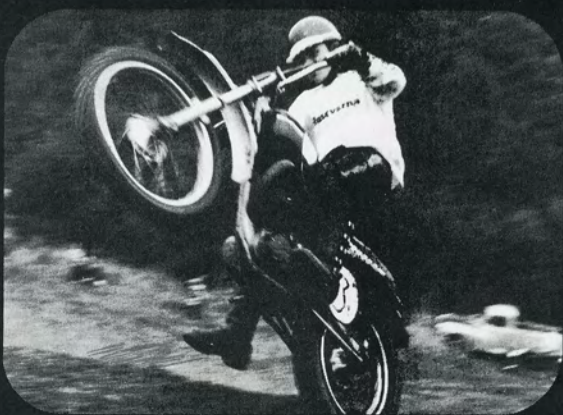
...fuld gas og fin kontrol over maskinen