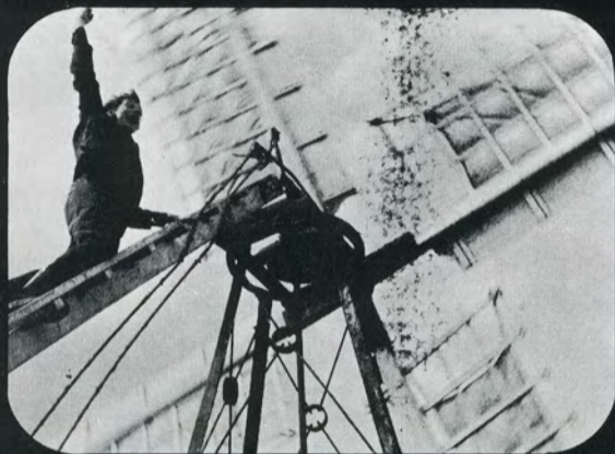
...livsfarligt at ændre de susende møllevinger