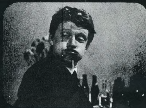
...er der penge til flere omgange?