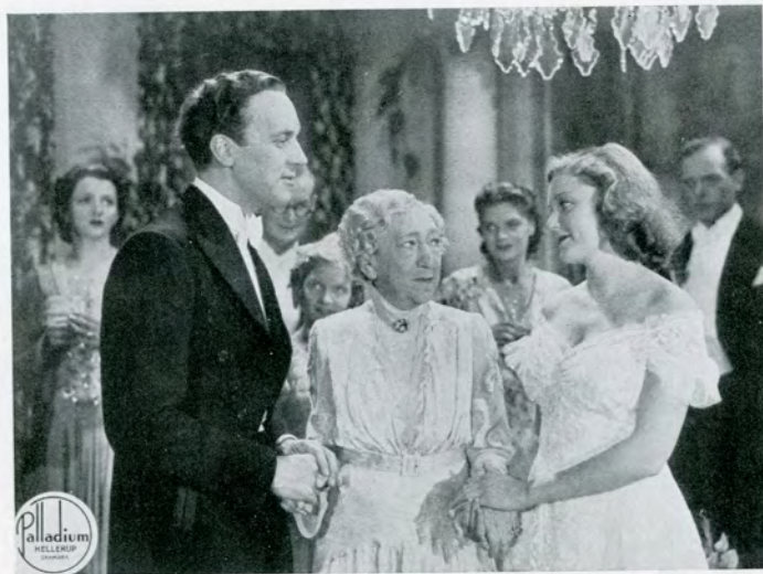
Det unge Par faar Tante Cramers Velsignelse

Livet og Menneskene har forandret sig, siden „Tante Cramer“ blev skrevet for 38 Aar siden; i denne Periode falder hele den sociale Udvikling og to Verdenskrige, og København er vokset — blevet en hel anden By end dengang; der maatte en indgribende Operation til for at omplante dette Lystspils Mennesker og Situationer til i Dag. Forhaabentlig vil min gamle Lærer ikke være alt