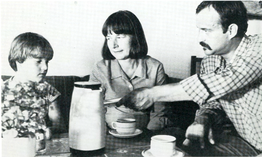
Hver tredje dansker får kræft.