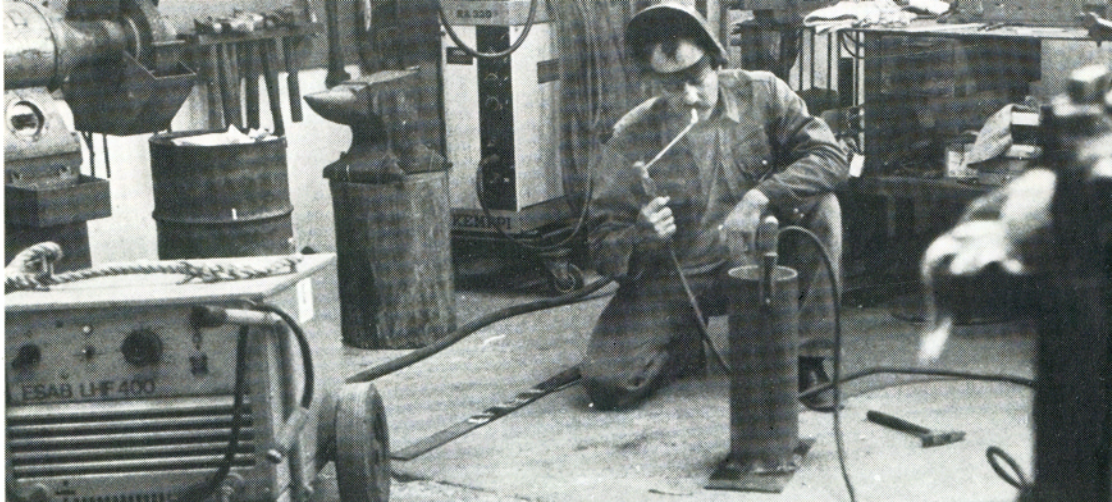
Risikoen ved rygning kan mangedobles af arbejdsmiljøet.

siden. Engelske skorstensfejere fik pungenkræft langt hyppigere end gennemsnittet. Da lægen Percival Pott i 1775 konstaterede, at mange skorstensfejere fik kræft, mente han, at et stof i soden var årsagen. Nu – 200 år efter – har skorstensfejere en firdobbelt kræftdødelighed og lever 13 år kortere end gennemsnittet.