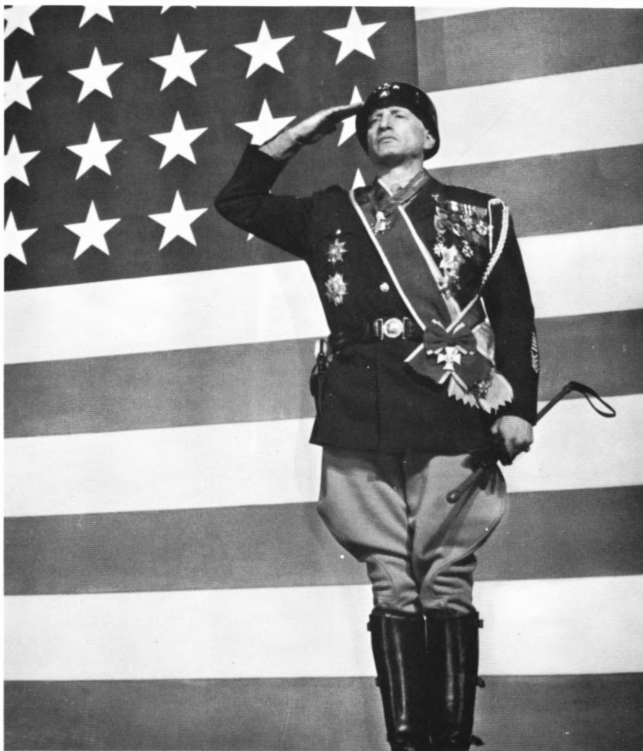
Den anden verdenskrigs mest kontroversielle kriger: George S. Patton i George C. Scotts person.

– Nej, aldrig den reaktion. Men som enhver anden instruktør spekulerer jeg over, om jeg kunne have gjort det lidt bedre, om jeg kunne have gjort enkelte scener mere klare. Det er altid i klipperummet man opdager, hvad man egentlig hav-