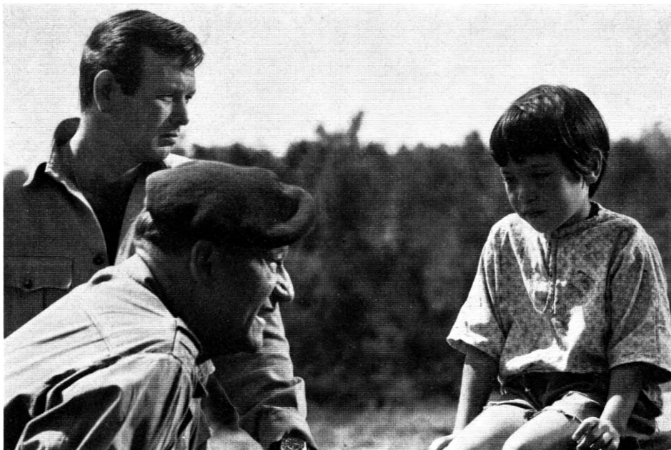
Oberst Wayne i aktion under optagelserne til »The Green Berets«, øverst med David Janssen i baggrunden.

Den eneste film om Vietnam-krigen, der er blevet lavet, er John Waynes »The Green Berets«, der bliver frigivet af Warner Bros-Seven Arts nu i sommer. »The Green Berets«, der er produceret og medinstrueret af Wayne, som også spiller helterollen som