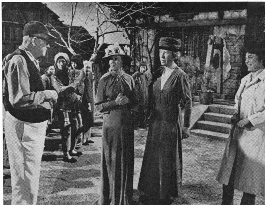
John Ford under optagelserne til „Seven Women“.

Ford er født i Cape Elisabeth i Maine som