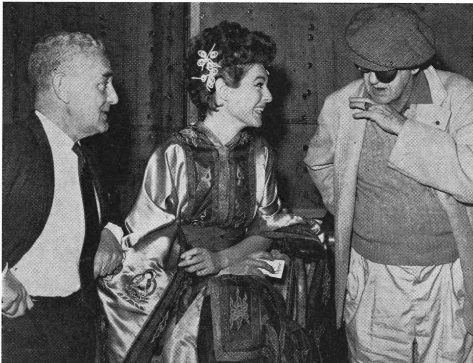
Anne Bancroft og John Ford („Seven Women“).

Ford har vundet seks Oscars, flere end nogen anden instruktør, to for dokumentarfilm fra krigens tid og fire for spillefilm. Han fik Oscar for „ The Informer “ i 1935, for „ The Grapes of