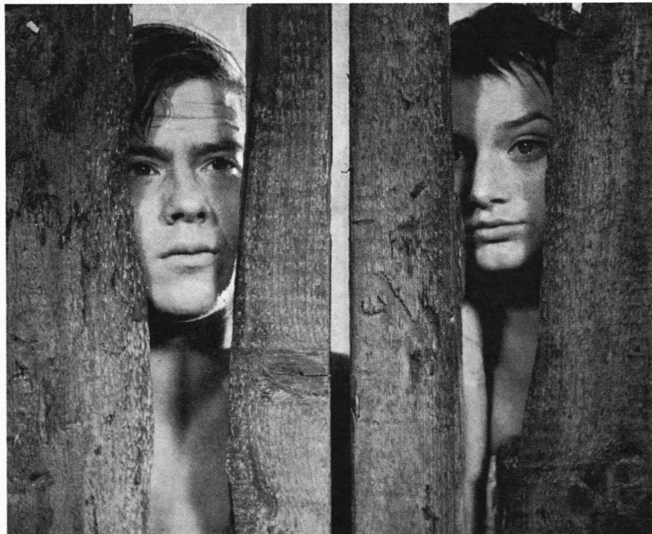
„Slnceto i sjankata“ (Sol og skygger), som kommer på de danske biografer.

Det var i 1951. Jeg spillede partisanen Bojko, ikke nogen særlig stor opgave, men – nå ja, filmen indfangede mig, og i 1954 fik jeg chancen som instruktørassistent på filmen „Sangen om mennesket“, en biografisk film om digteren Nikola Vaptsarov , som den 23. juli 1942 blev henrettet af de bulgarske fascister.