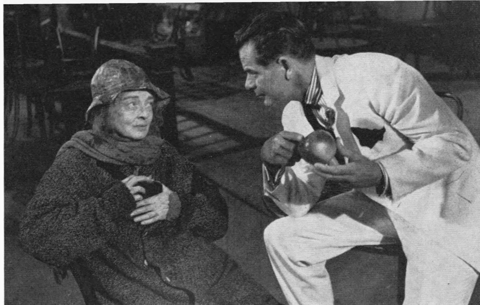
Bette Davis som Apple Annie og Glenn Ford som Dave the Dude i Frank Capras „Pocketful of Miracles“, som Glenn Ford producerer for „United Artists“.

gelseerne påbegyndtes i Rom i slutningen af juli med Alain Delon , Louis Seigner og Antonionis foretrukne „leading lady“, Monica Vitti i de ledende roller. Som medforfatter på manuskriptet har Antonioni haft Tonino Guerra .