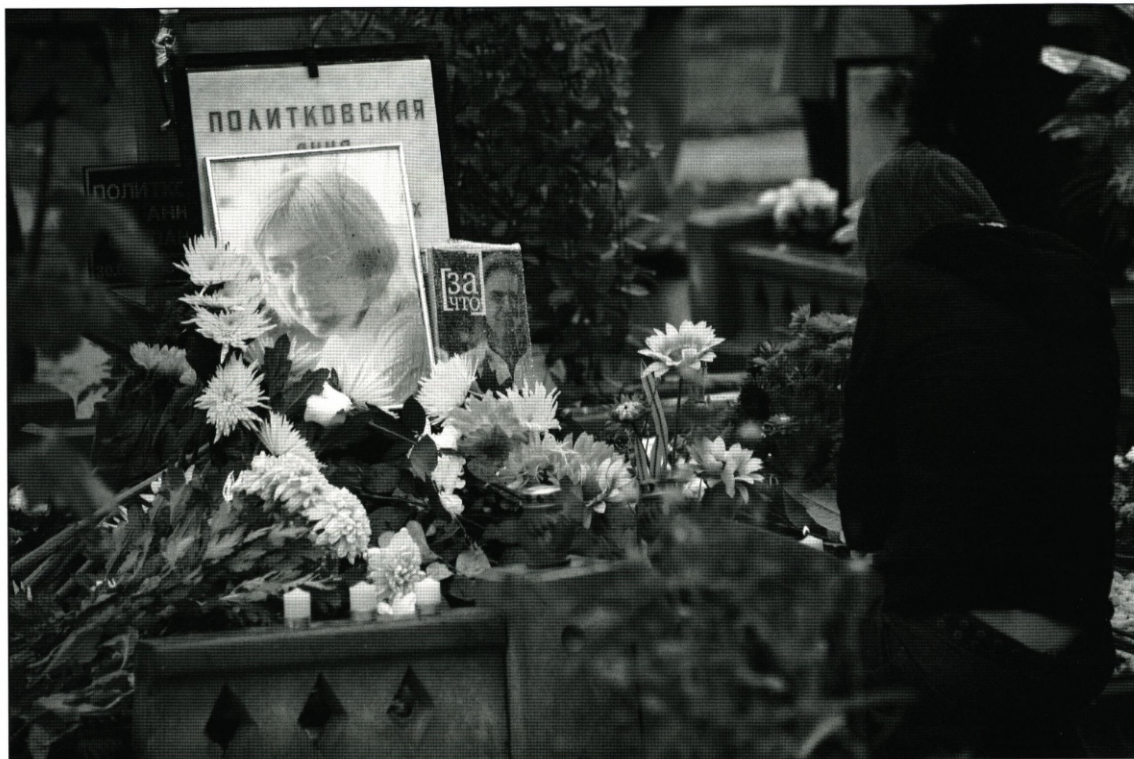
A Bitter Taste of Freedom (2011, instr. Marina Goldovskaja).