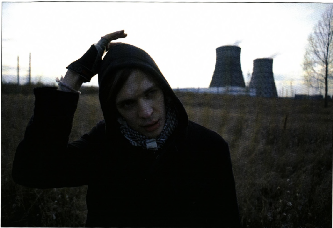
Tankograd (2009, instr. Boris Bertram).

1997 har været medlemmer af en forbudt politisk organisation. Filmen følger dem gennem et år, som de så som starten på et nyt liv med Ruslands valgfeber. Denne gang tydede samfundsfeberen på, at noget nyt ville ske. Men der skete intet.