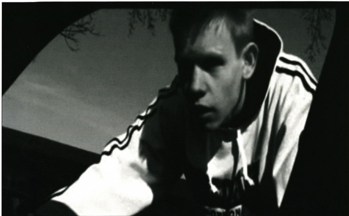
Blufferen (instr. Alexander T. Romanati, Magnus Jørgensen og Mathias Kildedal, Danmark 2009).

dens verden, som fungerer som en slags 'målepunkter'. Af samme årsag er dvoted på mange måder langt mere udadvendt og kommunikerende end de fleste kunstnerisk orienterede filmskoler.