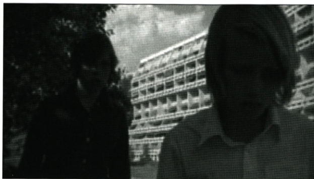
Robin (instr. Eirik Sæter Stordahl, Norge 2007).

Men ikke alene er dvoted et meget nordisk projekt. Når man sammenligner det med lignende tilbud i andre lande, står det klart, at det også er et ganske enestående netværk inden for media literacy og