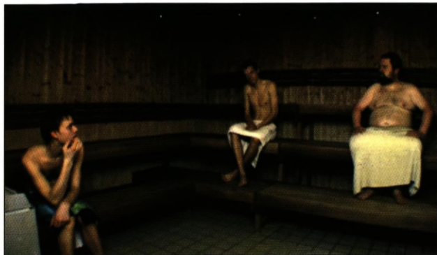
Sauna (instr. Gorm Just, Danmark 2008).

Hvem bruger dvoted? Med sine 10.000 medlemmer – og næsten 800 såkaldte core users , eller kerne-brugere, der uploader film og lægger indhold ud – er dvoted Nordens mest brugte web 2.0 filmsite.