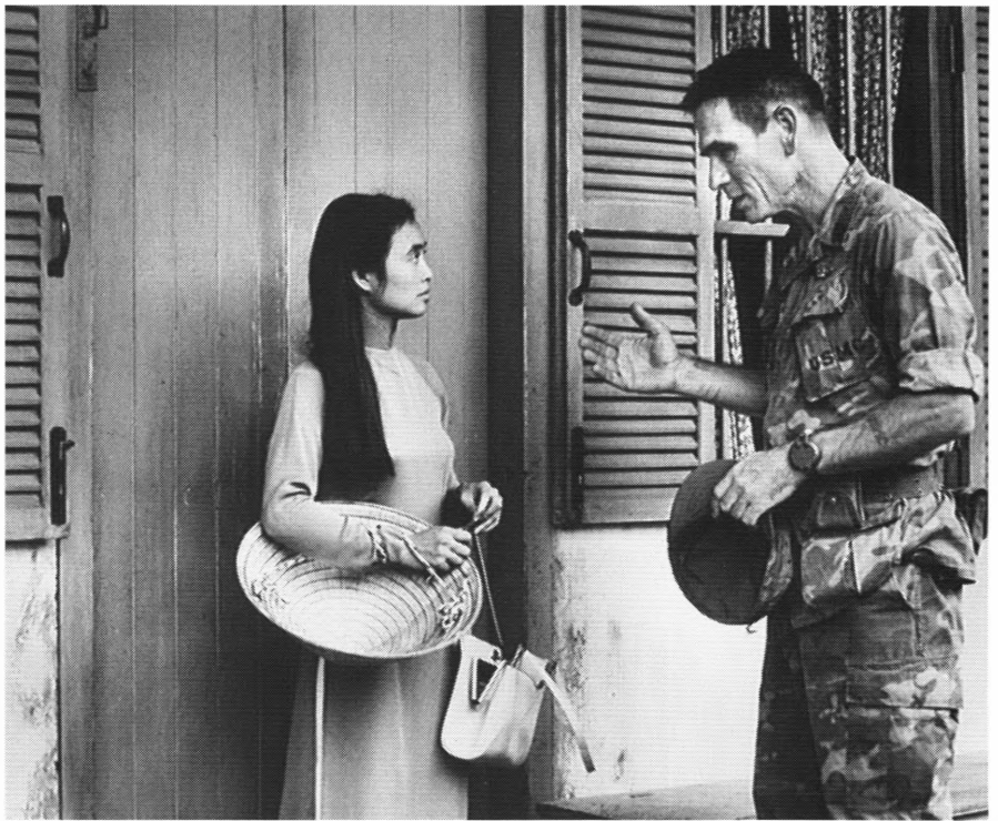
Side 22 (øverst): Tommy Lee Jones (tv) som forretningsmanden Clay Shaw sammen med Michael Rooker (midten) og Kevin Costner i JFK (91). Side 22 (midten): Tommy Lee Jones som skrap skurk i Kapring på åbent hav (92). Side 22 (nederst): Politimanden i Flygtningen (93). Denne side: Steve Butler i samtale med Le Ly (spillet af Hiep Thi Le) i Oliver Stones Himmel og Jord (93).

Lawrence Schillers Mander der ville dø med manus af Norman Mailer efter egen faktionsroman er et højdepunkt i tv-fiktionens historie. Den udnytter tv-filmens styrke i den umiddelbare hverdagsrealisme, som udspringer af tvs præg af direkte transmission (jfr. nyheder, sport m.v.), selve fornemmelsen af at få den direkte genkendelige virkelighed lige ind i stuen. Og samtidig er det i høj grad en kunstnerisk bearbejdet virkelighed, hvor miniserien fastholder en for tv usædvanlig psykologisk