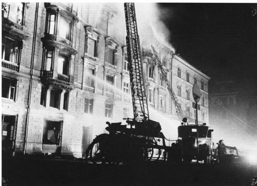
Her går hundreder af film, plakater m.m. op i røg – tysk sabotage på Palladiums bygning i København 1944.

For få uger siden erhvervede museet 50 gamle plakater, fortrinsvis fra Fox og