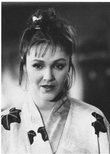
Øverst Wendy Gazelle og Ayub Khan Din. Nederst Frances Barber. S. 8 øverst Shashi Kapoor. Nederst Frances Barber og Ayub Khan Din.