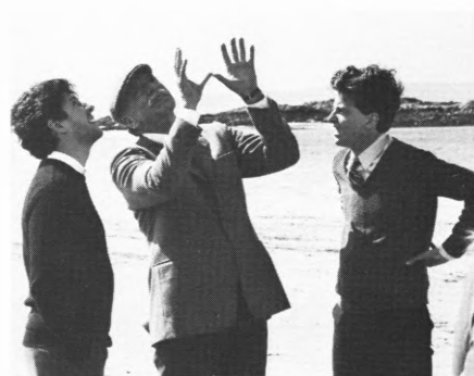
Øverst en scene fra »Bugsy Malone«, herover Burt Lancaster (i midten) i en scene fra »Local Hero«

imellem at bruge alle frie albuer. »I kærlighed, krig og filmproduktion gælder alle kneb«, lyder det i de kredse.