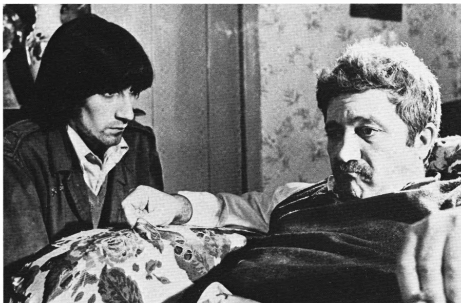
Cal og hans far

Denne stemning, hverdagsbeskrivelsen i små glimt, i korte indstillinger og sekvenser, de få replikker og de