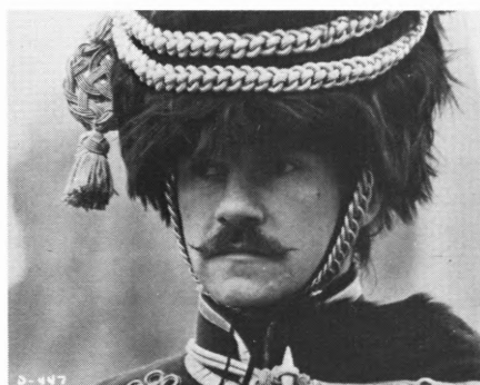
Øverst David Puttnam sammen med Ridley Scott, herover Martin Sheen i Scotts »Duellanterne«

individer, der instinktivt ønsker at lave samme film«, skrev Puttnam diplomatisk til Louis Malle, da han alligevel hellere ville arbejde med Joffé på »Killing Fields«. Han fortsætter i øvrigt samarbejdet med Joffé i »The Mission«, en film på vej, der foregår i Sydamerika efter den spanske erobring. Også den er en storproduktion med et budget på 12 millioner pund.