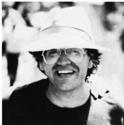
Filmens instruktør Robert Zemeckis.

Det sidstnævnte forsøger vor lykkeridder at rette op på. Han får lige fat i dillens hale, da den forsøger at gøre