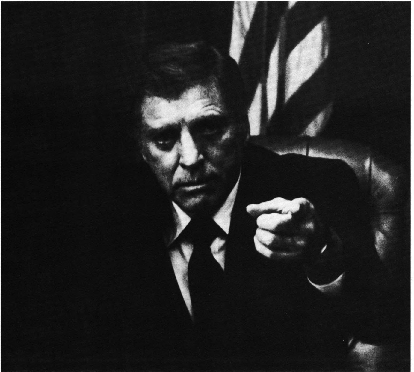
Burt Lancaster i en scene fra Peckinpahs comebackfilm »Den blodige weekend«

mans hjælp og styring – at båndе sin egen medvirken på forhånd. Mens Danforth for åben TV-skærm bliver præsenteret for Fassets anklager, dokumenteret af videooptagelserne af såvel weekendens barske begivenheder som mordet på Fassets kone, kan Tanner derfor opspore transmissionsvognen, nedskyde Fassett og befri sin familie.