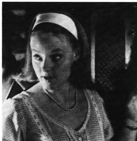
Jodie Foster – et dårligt navn i Vesttyskland?