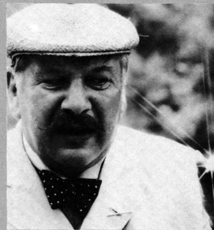
Herover Peter Ustinov i scene fra »Evil Under the Sun«, der fører nye facetter til Hercule Poirot-portrættet.

Til højre Toshiro Mifune, der har hovedrollen i John Frankenheimers nye film »Udfordringen«. På billedet over Mifune ses Frankenheimer