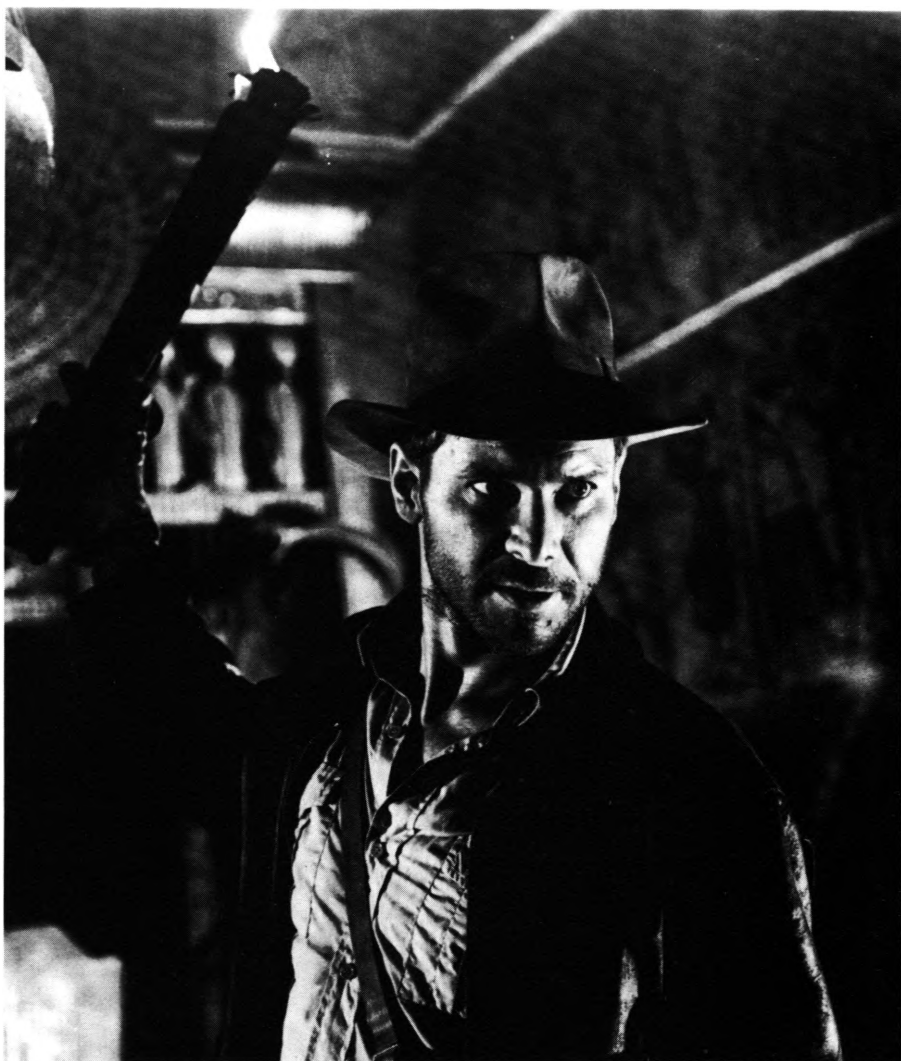
Harrison Ford i »Jagten på den forsvundne skat«.