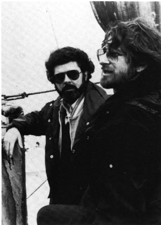
George Lucas og Steven Spielberg.

Indiana Jones besidder heltemod, kondui- te, styrke og held i store doser, mn han er intet overmenneske. Mest kan han i sine handlinger minde om gode gamle »Willy på Eventyr«, sådan som denne tegneserie var i 1920'ernes Illustreret Familie-Journal, eller om Hergés »Tintin«, der altid forstår at red- de sig ud af en knibe. Nok er Indiana Jones fremstillet som en tough guy og lidt af en børste, og både Willy og Tintin er jo de rene dengsedrenge, men alle havner uafbrudt i situationer, der involverer mystiske tem- pler, begravede skatte, hemmelige ud- og ind- gange, magiske statuer, upålidelige og