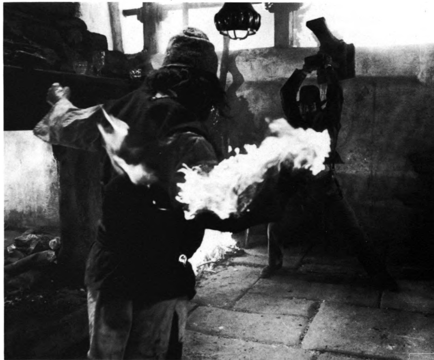
Harrison Ford i en af de mange action-scener.

kommercielle træffer hos det amerikanske publikum, er instrueret af Spielberg - hans første film efter den gebommerlige fiasko med »1941« - og produceret og medfattet af George Lucas, der ellers bruger det meste af sin tid på at producere sequels til »Star Wars«. Den lægger sig i forlængelse af især Lucas' film som et dyk ned i barndommens mytologiske heltegyrdelse, genoplivet med nostalgisk reverens over for aner i tegneseri- en, de kulørte drengebøger og naturligvis især de eventyrlige underholdningsfilm.