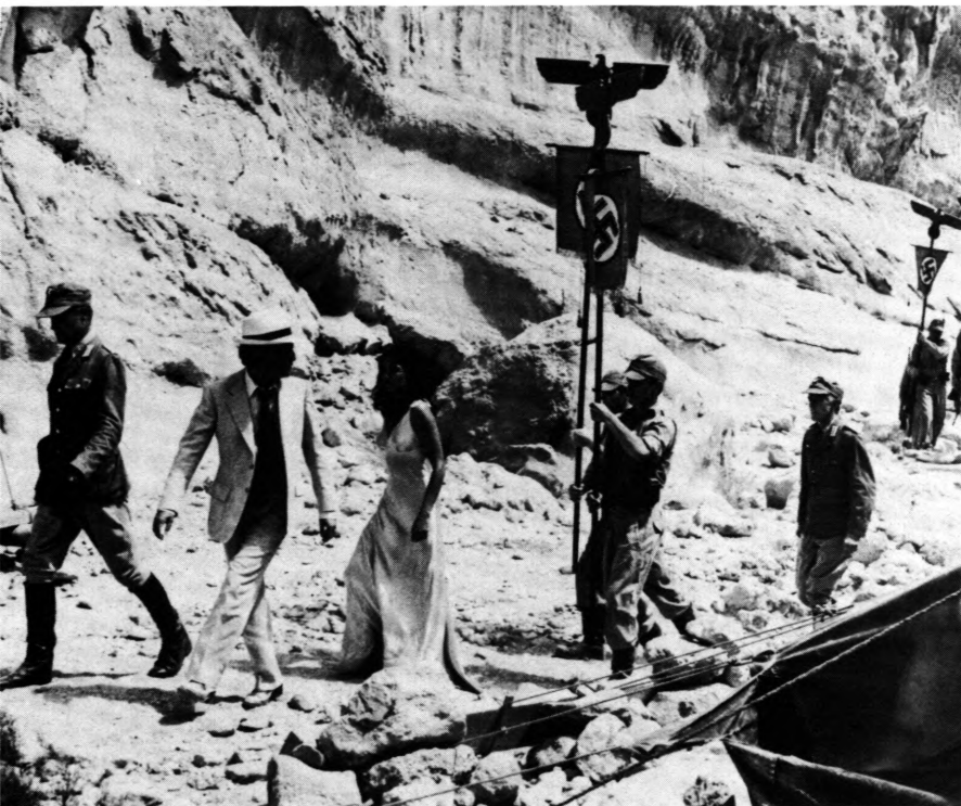
Karen Allen er gidsel for nazisterne og holdes siden fanget sammen med Harrison Ford.

Spielberg og Lucas har fundet ud af, hvilke kostelige fund der kan gøres i nostalgis skattekasse, og nu er de ifærd med at fremdrage klenodierne, mens gode ånder og guddommeligt talent står dem bi.