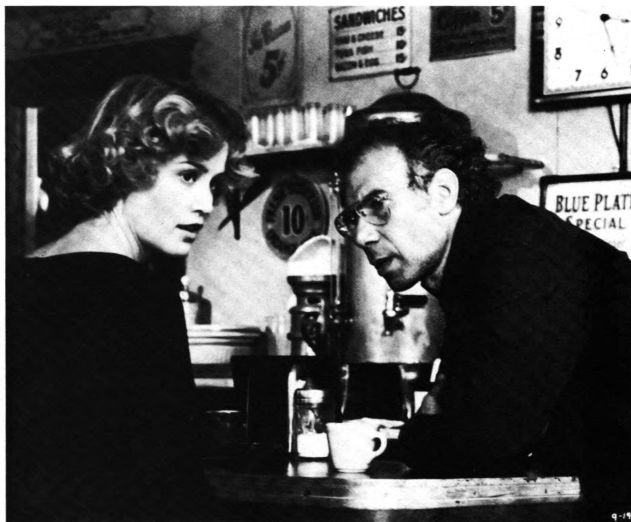
Bob Rafelson instruerer Jessica Lange

»Min film ville være amoralsk, hvis de to hovedpersoner til sidst kørte bort i solnedgangen. Men det gør de jo ikke, historien er en tragedie, og de to hovedpersoner er selv rædselsslagne over det mord, de begår. Så stærk kan en passion altså være, måske ikke for alle mennesker, og dog? Masser af mennesker går rundt og ønsker én eller anden død, men tør bare ikke påtage sig ansvaret for denne død, og i mine øjne er der ingen moralsk forskel mellem dette ønske og selve handlingen. Men samtidig er der i filmen, og