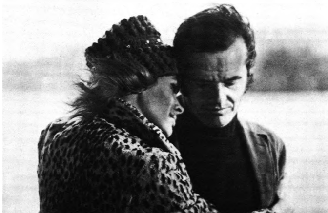
Til venstre Bob Rafelson. Til højre scene fra »Five Easy Pieces«. Yderst til højre scene fra »Stay Hungry« og nederst scene fra »The King of Marvin Gardens«

gere filmatiseringer af bogen mener jeg, at min er den eneste, der er trofast mod James M. Cain. Viscontis »Osessione« var en meget vigtig film, begyndelsen på neorealismen, men den var en helt anden film end »Postbudet ringer altid to gange«, mens MGMs version fra fyrrerne havde en forkert periode-atmosfære. Den havde en typisk englænder i ægteemandens rolle, skønt han dog er græker, og den var underlagt datidens censur. Den var en film om personernes garderobers omfang!«