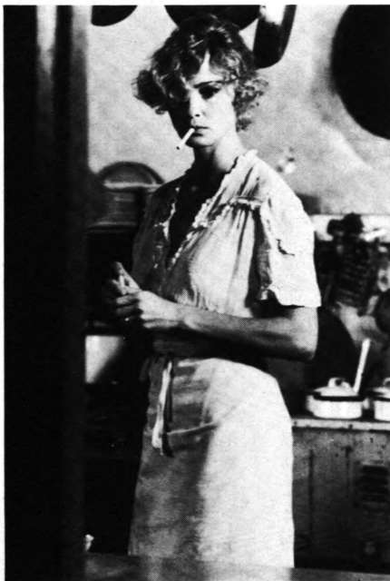
Jessica Lange i Rafelsons »Postbudet ringer altid 2 gange«

jeg aldrig munter, når jeg laver film, jeg smiler ikke og slapper ikke af, men opfører mig således...« (Her rejser Bob Rafelson sig igen fra sin stol, ser længe og indtrængende på interviewereren, klør sig på hagen, går rundt i cirkler, står længe ubevægeligt stirrende igen, gravalvorlig. Intervieweren får nu sved på håndfladerne og erindrer siden, at Bob Rafelson faktisk kun smilede én gang under hele den timelange samtale).