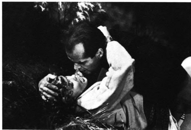
Fine versioner af »Postbudet ringer altid to gange«

Det betyder ikke, at man ikke forbliver den samme person, men at man tillader nye facetter af personligheden at komme frem. Som min næste film vil jeg f.eks. gerne lave en ny musical – min debutfilm var også en musical – og gør jeg det, vil alle sige, at nu er jeg gået på kompromis. Men hvis jeg nu har lyst til at lave en musical?».