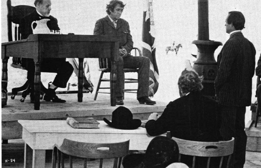
Scene fra »Tom Horn« – før dommen falder