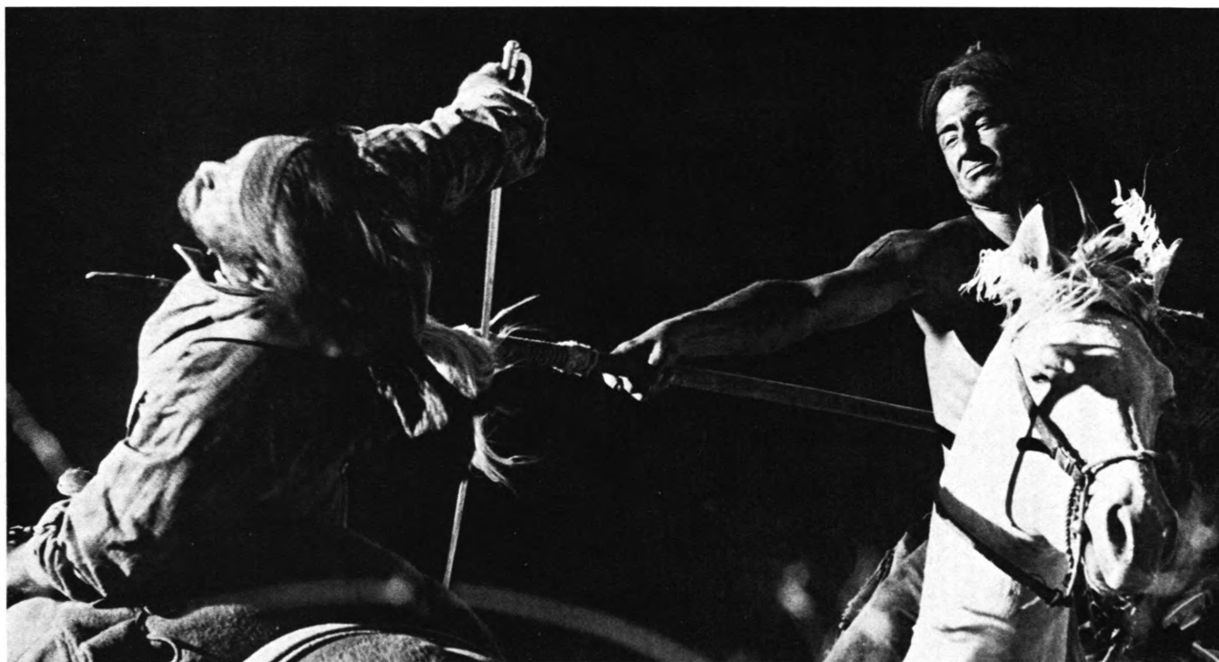
Martin Sheen og Sam Waterston i scene fra »Eagle's Wing«