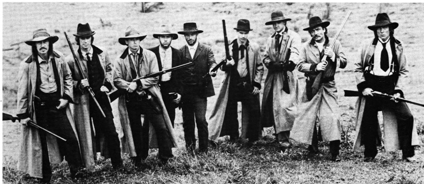
Fire gange brødre i »The Long Riders« – David, Keith og Robert Carradine, Nicholas og Christopher Guest, Dennis og Randy Quaid, Stacy og James Keach

Det tætte familiesammenhold, forstærket af den bitterhed, der efter borgerkrigen fandtes hos den tabende part, er et vigtigt element i »The Long Riders«. Kvinderne er alle stærke og stædige, de sætter ikke spørgsmålstegn ved deres mænds aktiviteter, men er ubetinget solidariske. Meget tyder på, at Cole Younger i virkeligheden har haft lige så meget at skulle have sagt som Jesse James. Også han havde været guerilla-soldat under Quantrill og var senere kaptajn i den regulære sydstats-hær. Han må have haft en vis uddannelse, han talte og skrev i hvert fald grammatisk korrekt. I 1903, da han var blevet benådet og løsladt fra fængslet, skrev han en selvbio-