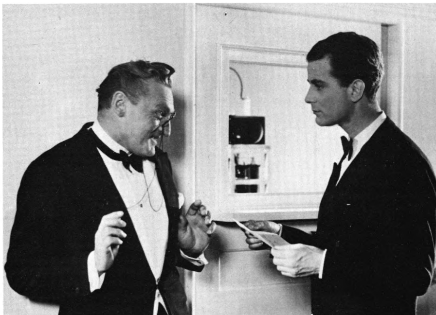
Scene fra »Flugten fra millionerne«

producerede »En handfull ris«, optaget i Siam, blev præmieret i Venezia 1939. Det er en naiv, dårligt sammenklippet Flaherty-pastiche om Man Against Nature, in casu et nygift pars kamp mod såvel tørke som tigre for at skaffe sig den daglige håndfuld ris, som den svenske husmor i filmens pegefingrende prolog bare vil smide i affaldsskunken.