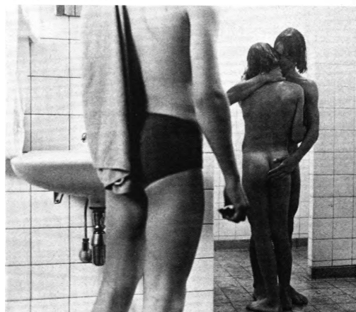
»Du er ikke alene«

Det kræver meget større nænsomhed og finfølelse for tilskuernes reaktioner, at bryde tabuer så der virkelig lukkes op for noget inde i tilskueren – det nytter ikke at diske op med velmente klicheer, der faktisk afslører at instruktørerne ikke har fattet en pind af hvad det drejer sig om. Det er spild af god film og penge, at lave film med nøgne appeller til inderkredsen, de allerede indviede. Det må