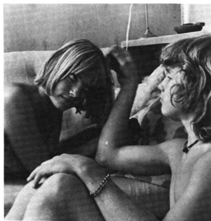
»Måske ku' vi«