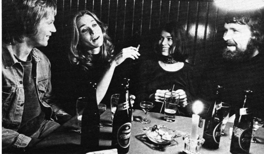
Scene fra »Dreng«

lingsstyrende, end egentlig problematiserende.