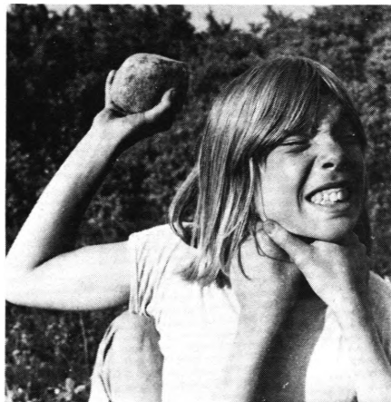
»La' os være«

Jeg var 14 år da »La' os være« havde premiere og således et par år ældre end den aldersgruppe, som filmen skildrede. Jeg var spændt på at se, hvordan andre unges tilværelse formede sig, hvilke problemer de måtte ha', deres forhold til voksne, til hinanden. Kort sagt: Jeg brændte efter at få min virkelighed bekræftet! Jeg syntes, at »den var da meget