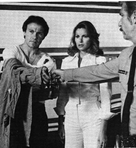
Harvey Keitel og Raquel Welch i »For fuld udrykning«.

Hvor kvaliteten i de seks første film om Olsen-banden steg støt fra gang til gang, er den faldet siden omend det ikke er i katastrofal målestok. Den niende og nyeste i serien virker først og fremmest mindre idérig end de tidligere (en scene som den med fiskestangen og brillerne ville ikke være sluppet med i de tidligere film), og nogle af de ideer, man har haft, fungerer bedre på papiret end på film (man stjæler Fællesmarkedets smørpukkel og bryder ind i