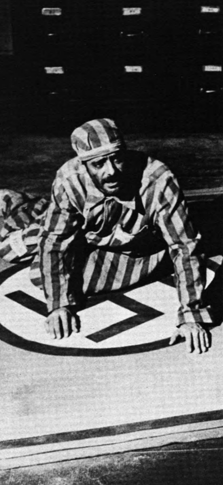
Scene fra »Syv skønheder«.