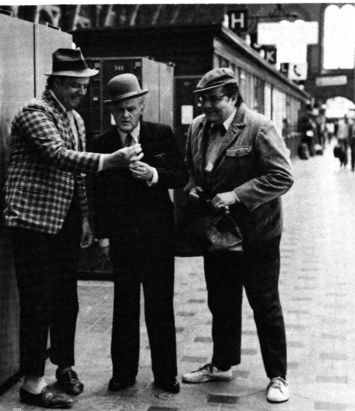
Olsen-banden på spil – for niende gang.

Verdensbanken). Vore tre hovedpersoner er fortrinlige, og Egon Olsens figur står skarpere end i den foregående film, men bifigurerne virker lidt slappe (fx. Paul Hagen og Ove Verner Hansen). Den rent filmiske originalitet er heller ikke så påfaldende denne gang, og visse scener minder lidt for meget om »Huset på Christianshavn«, hvad der ikke er ment som nogen kompliment i denne sammenhæng. Men vi ser dog med forventning hen til jubilæumsfilmen næste år (det bliver måske den sidste?), hvor Balling og Bahs ligesom er forpligtet til at levere det helt overgåede. (Danmark 1977). I.L.