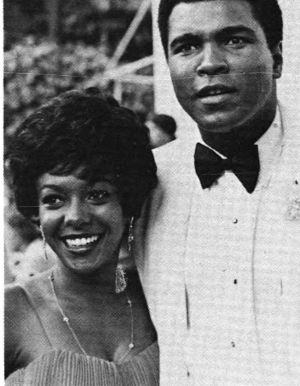
Muhammed Ali i sin egen film.