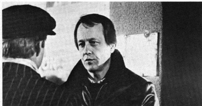
George Roy Hill

George Roy Hill (f. 1926), gjorde under den anden verdenskrig tjeneste i det amerikanske flyvevåben, studerede derefter på Yale University og på Trinity College i Dublin. I Irland har han virket som skuespiller i Cyril Cusacks teaterselskab. Under Korea-krigen indkaldt i to år, derefter til TV først som skuespiller, siden også som forfatter, instruktør og producer. Han har bl. a. skrevet (og spillet med i) stykket »My Brother's Keeper« (1954). – George Roy Hill har iscenesat »The Forger« (1955, også producer), »A Night to Remember« (1956, også forfatter og producer), »Billy Budd« (1956), »Good Old Charley Fay« (1956), »The Helen Morgan Story« (1957), »Last Clear Chance« (1958), »Child of Our Time« (1959), »Judgment at Nuremberg« (1959) og »Blast at Centralia No. 5« (1960). Som teaterinstruktør debuterede George Roy Hill i 1957 med »Look Homeward Angel«. Siden har han yderligere iscenesat »The Gang's All Here« (1959), »Greenwillow« (1960), »Period of Adjustment« (1961), »Moon on a Rainbow Shawl« (1962) og »Henry, Sweet Henry« (1967), en musical baseret på »The World of Henry Orient«.