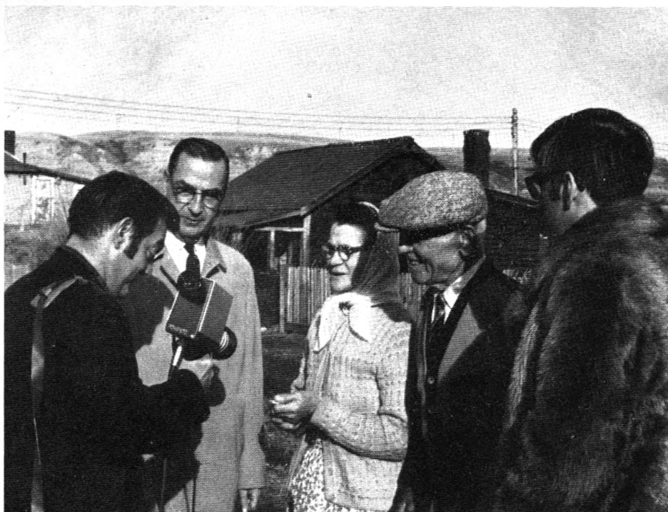
»Challenge for Change«: filmmediet bruges direkte som kommunikationsmiddel.

Ekspedition: Ellevadsvej 4, 2920 Charl. Udgiver: Kirke og Film.