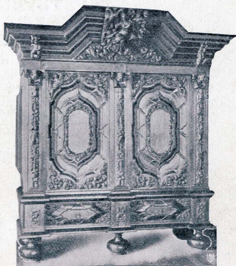
Skab i Barokstil

Trykt paa JM Toturpresse, leveret af Lange & Raaschou, Kbhvn.