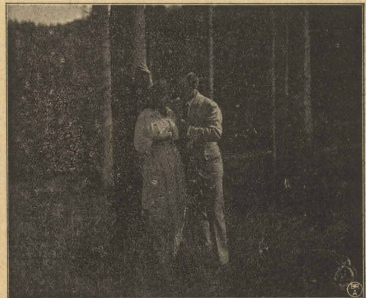
Solglød i Skoven