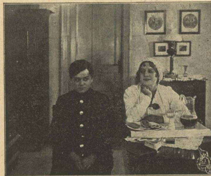
En Pigernes Jens?