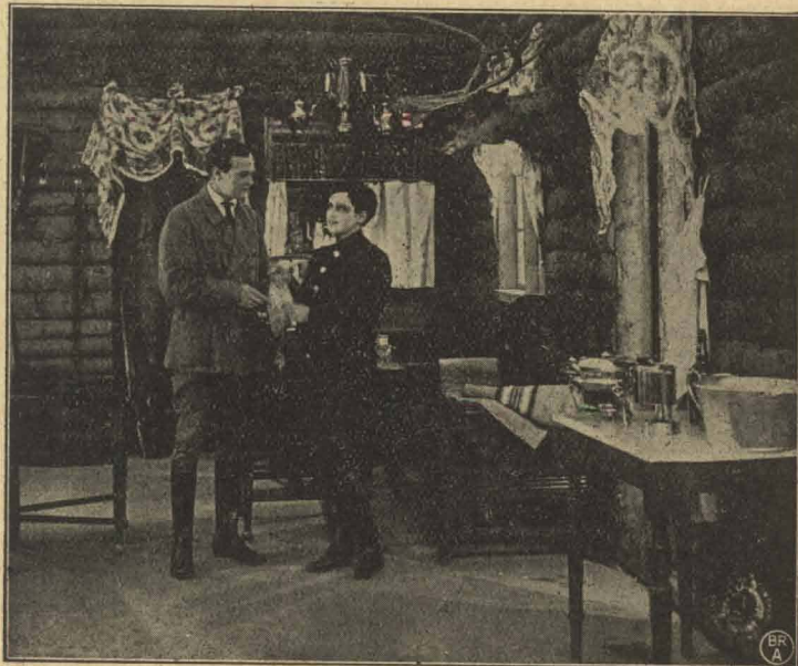
En huslig Chauffør

ikke at røbe sig. Hun passer paa som en Smed — men en Dag gaar det dog uheldigt.