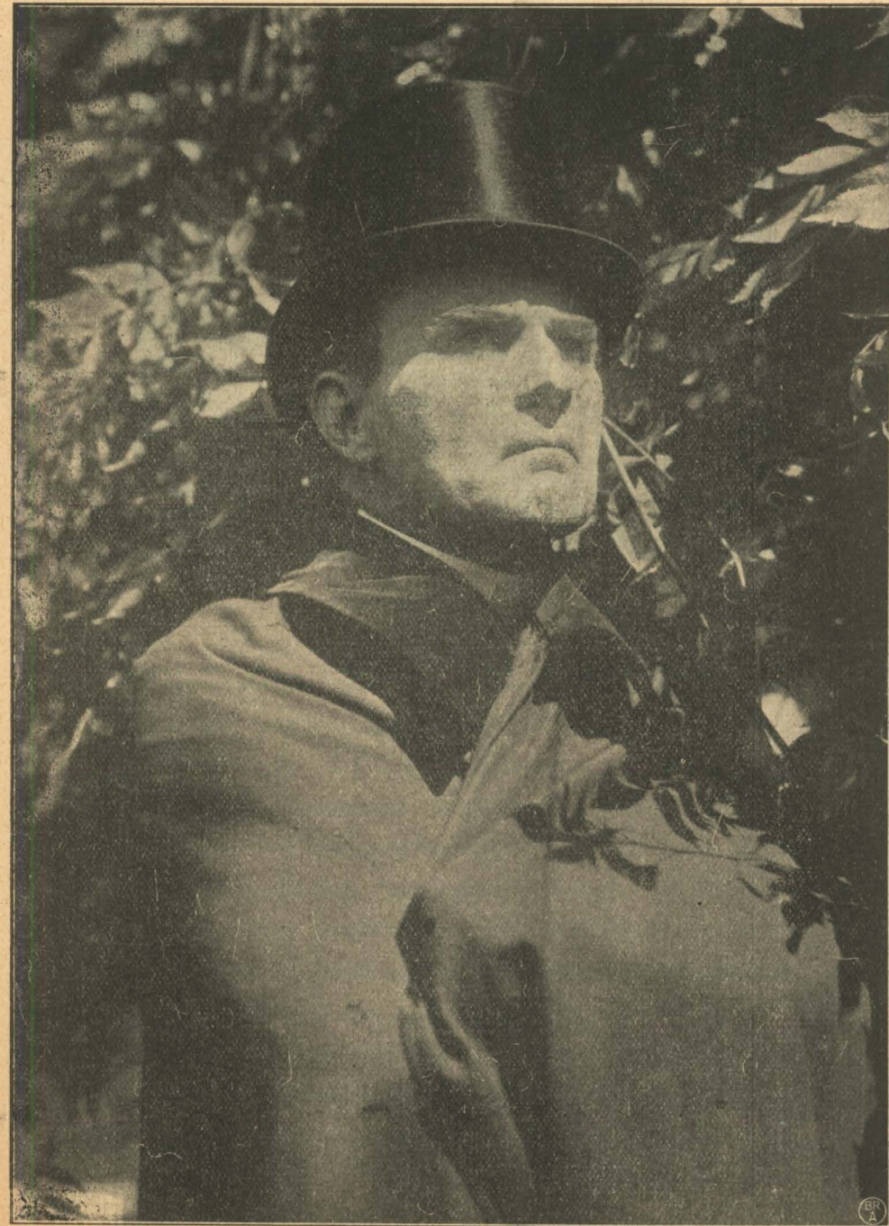
»Sjæletyven« venter forgæves.