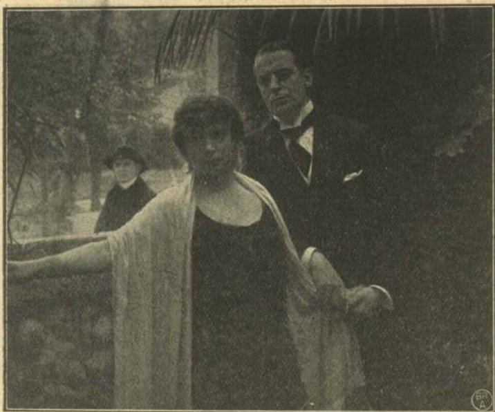
En Pagt for Livet.

en planmæssig Gennemgang af sit Forbryderalbum finder han et Fysiognomi, der saa paafaldende minder om Dr. Harmodis, at han tør antage, at de tilhører samme Person. For at skaffe sig Vished forklæder han sig som en af den paagældende Forbryders Medfanger og beslutter i denne Skikkelse at aflægge Dr. Harmodi — alias Tugthusfangeren Caspar Ronald — en Visit. Dr. Harmodi, der ingen Anelse har om, at Forklædningen er falsk, gaar i Fælden og røber sig overfor sin tidligere Kammerat.