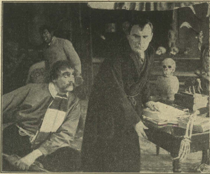
Vennen fra Fængslet.

en eneste af de større Ejendomsbesiddere er gaaet fri. Men Grev Coltenberg har Tyven — eller Tyvene — endnu ikke værdiget en Visit, og det skønt det er en offentlig Hemmelighed, at han ejer nogle meget kostbare Smykker. Det er netop dette, der forurolicher Greven, og som har faaet ham til at skrive efter Jurian Fox, hvem han nu foreslaar at komme til Stede ved Selskabet for paa den Maade at lære nogle af Egnens mere fremtrædende Personligheder at kende.